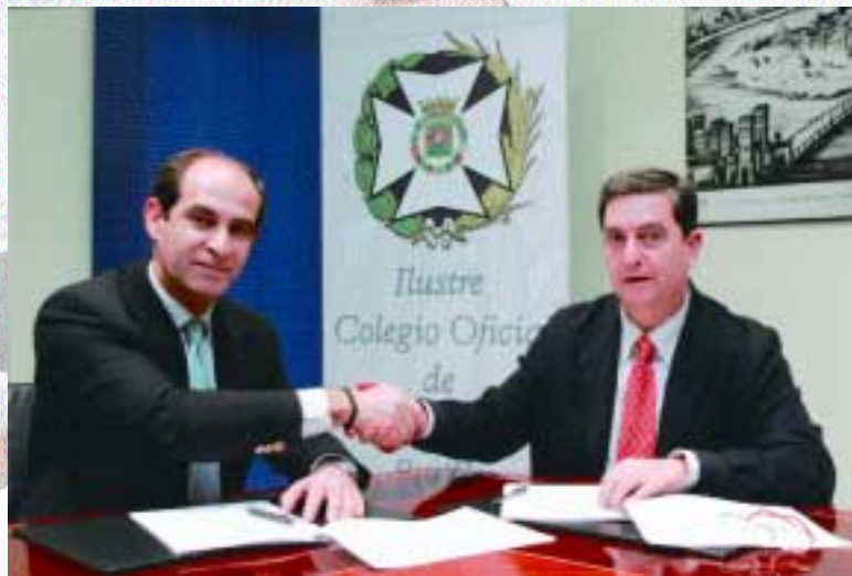
Firma entre los responsables de Mafre Caja Salud y Colegio