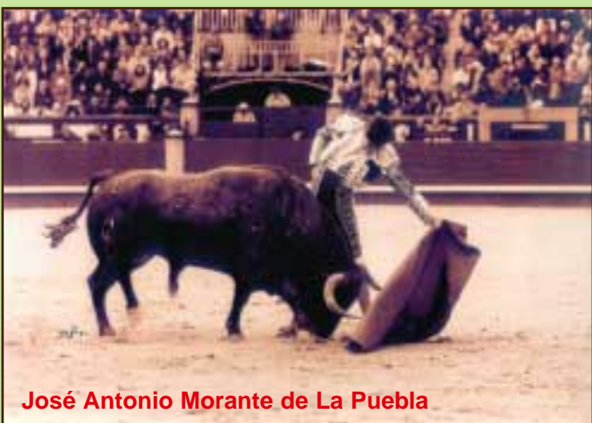
José Antonio Morante de La Puebla