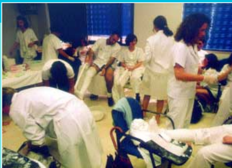
Alumnos de un curso de yesos en el Colegio

El profesional sabe que, bien a través de la página "web" ( www.enfermundi.com/sevilla ) o por los distintos modos de información, el contacto entre el diplomado y su colegio profesional es ágil y permanente, encontrando información, noticias y eventos que, globalmente, todo profesional en activo debe conocer máxime cuanto la información que va a recibir se elabora desde una óptica puramente profesional, libre de compromisos que no sean los de la propia enfermería y sin dependencias de ningún otro poder o influencia partidista. El Colegio de Enfermería, como entidad declarada de Derecho Público, es y existe en tanto en cuanto existe la profesión a la que representa. Así viene suce-