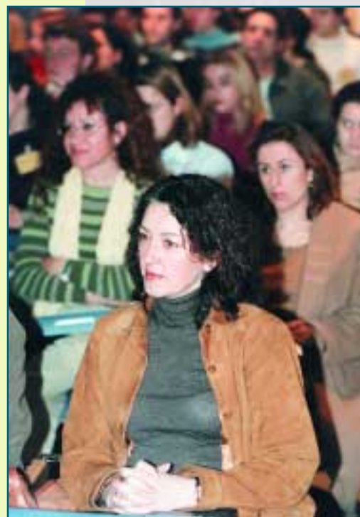
La enfermería especializada espera resultados

Y todo porque la esquizofrenia, (que no comporta que el sujeto pueda llevar una vida normal siguiendo su tratamiento adecuado), los esquizofrénicos son los pacientes que con más frecuencia o facilidad entran en sucesivas crisis. Se estima en 75.000 los ciudadanos que, en Andalucía, sufren de esquizofrenia, dentro de la cifra de dos millones de personas afectadas por dolencias mentales.