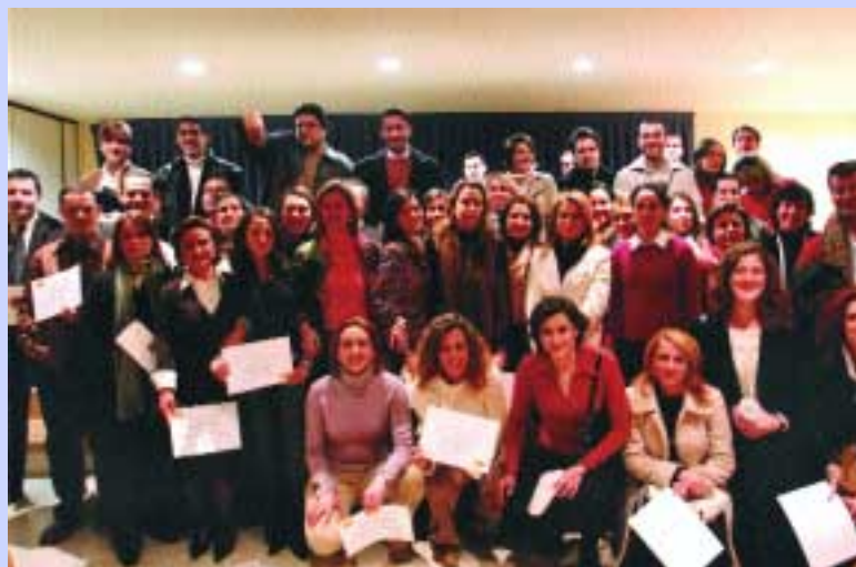
Tras el éxito del primer curso, nueva edición

Dirigido a DUE/ATS, el curso consta, como el anterior, de 300 horas de presencia física y las 40 plazas convocadas se cubrirán por concurso de méritos dado que el número de solicitudes ha quintuplicado el de plazas establecidas en la convocatoria.