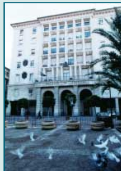
Palacio de Justicia de Sevilla

E l Servicio Andaluz de Salud (SAS) ha decidido recurrir ante el Tribunal Supremo (TS) la sentencia dictada por el Tribunal Superior de Justicia de Andalucía (TSJA) por la que se condenaba al SAS a abonar a un colegiado de enfermería sevillano la cantidad de 25,49 euros por "exceso de jornada" o reclamación de cantidad "en concepto de atención continuada C". El SAS opta por poner en marcha toda su maquinaria legal antes que proceder al abono de una cantidad que no parece merecer, a simple vista, acudir al Supremo.