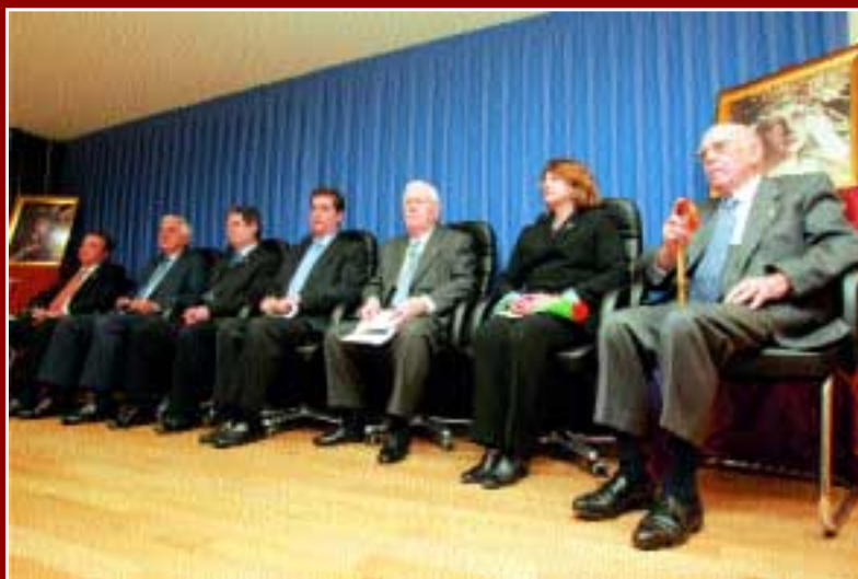
Presidencia del acto cofrade en el Colegio

Al quedarnos ya sin ti Porque no quiere Triana No termines de expirar Guarda muy dentro tu alma No la dejes escapar Quédate aquí con nosotros Por todo la eternidad Que en la expresión de tu rostro De dolor y de ansiedad Ve Triana en su Cachorro A la autentica verdad.