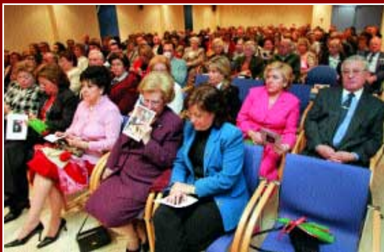
El Pregón renueva, cada año, la mayor atención

Porque no quiere Triana Tú no te puedes morir Y destrozarnos el alma