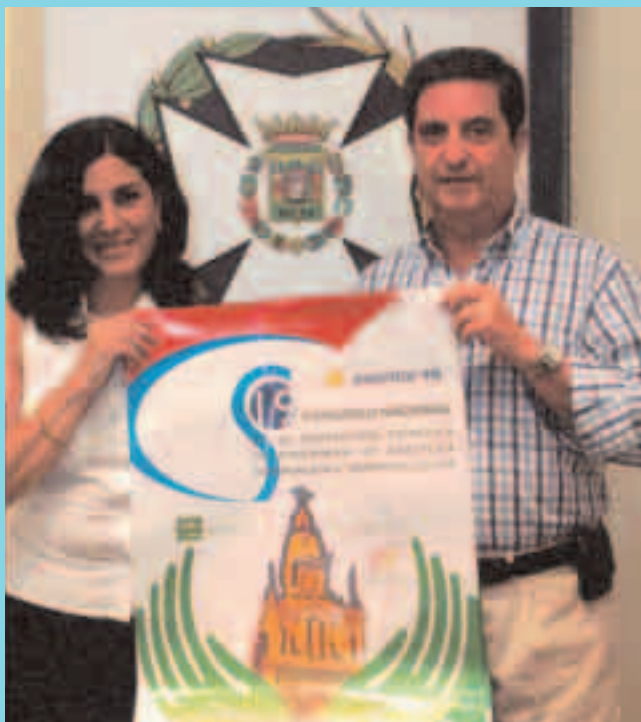
Presentación del Congreso en el Colegio

del propio Hospital me aventura a adivinar que, al final, todo irá mas o menos cuadrado, si hablamos en términos económicos. Por ello mismo, permítaseme que cite a algunas de las firmas que van a colaborar con nosotros mediante la instalación de stands: Prin, Alaris, Baxter, Abbott, técnicas Médicas, Stryker..."