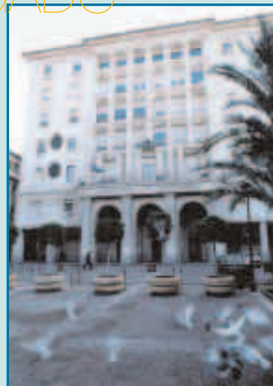
Palacio de Justicia de Sevilla

E l Tribunal Supremo ha dictado un Auto por el que se divide una nueva vía para resolver las diferencias de los trabajadores del SAS. Si hasta ahora eran los Juzgados de lo Social quienes atendían estos asuntos, el auto del TS establece que, en el futuro, podrían resolverse ante el Juzgado de lo Contencioso-Administrativo