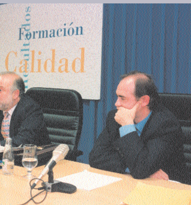
ces informando al colegiado

Todo ello sin olvidar que las Jornadas son de carácter gratuito para los asistentes. Eso sí; avisan que existirá un inconveniente: la lista de admitidos se cerrará cuando esté cubierta la capacidad del Aula Fernanda Calado. Además, a los inscritos se les entregará, a la conclusión, luego de un simulacro de juicio sobre un caso Penal, el diploma con acreditación del S.N.S.