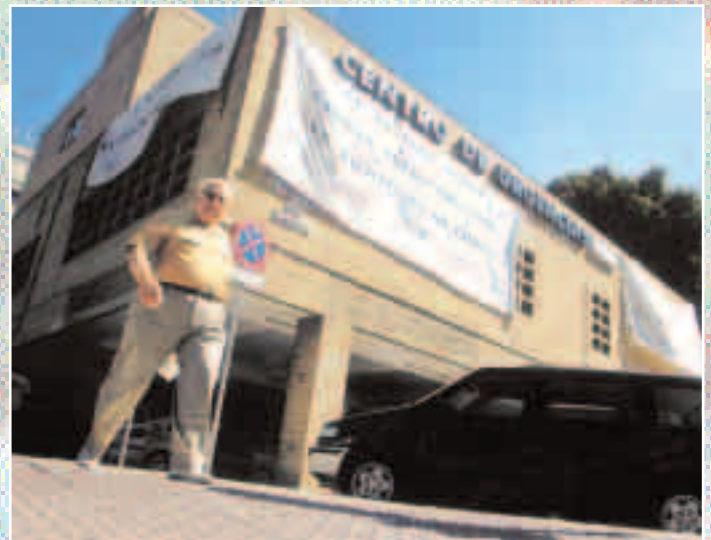
Pancartas contra el cierre del Equipo

manifestaciones, para exigir que el Equipo, continúe prestando la atención que tanto valoran los ciudadanos en base a una media de 130 consultas/día lo que equivale a aliviar el habitual colapso de las Urgencias en los hospitales de la ciudad.