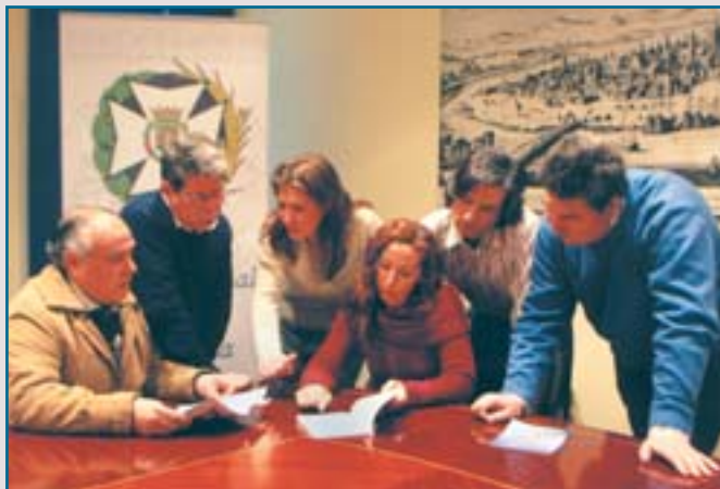
Contenidos profesionales para el transplante.

Y brindan el resultado de esta Guía a la profesión y, sobre todo, a “los enfermos que, una vez en su domicilio, tienen unas necesidades, a veces transformadas en angustia, de recibir información y consejos sobre esas veinte preguntas que hemos transformado en otras tantas respuestas. La diálisis post-trasplante es muy común y el paciente se ve empezando una nueva vida donde el no saber sobre esto y lo otro le puede crear dolores de cabeza. Para ellos nace esta obra y si les ayudamos, que creemos que sí, habremos cumplido con nuestro objetivo”, dejan escapar, entre tímidos y precavidos, como si temieran incomodar a alguien. Todo lo contrario: es un excelente servicio profesional al enfermo trasplantado renal.