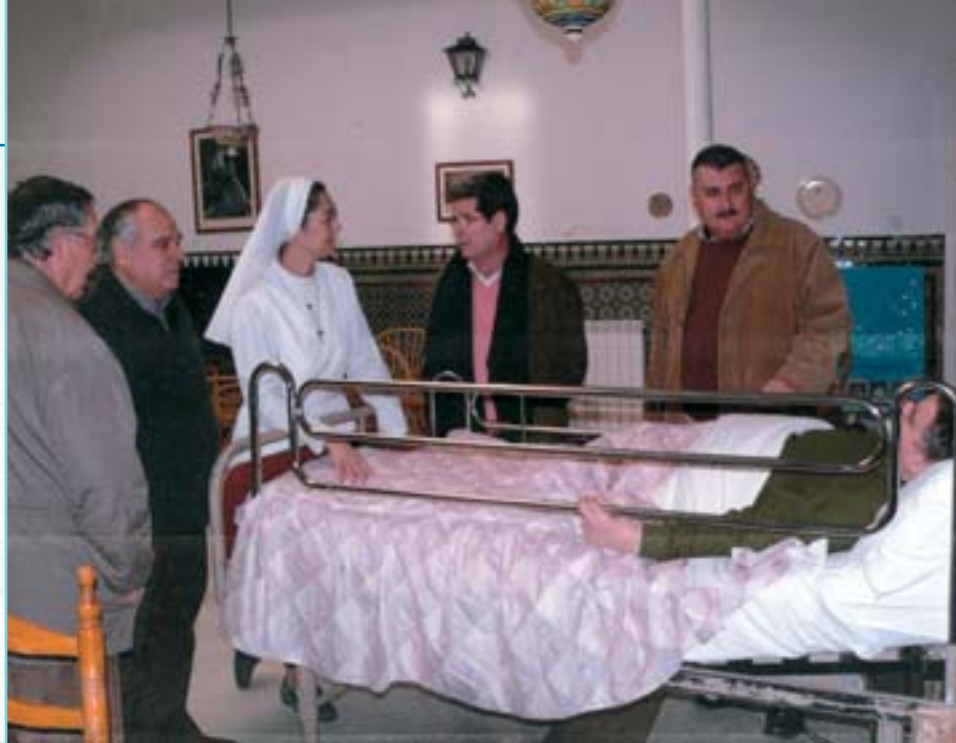
“Aquí recibimos a los enfermos más desheredados”.

En este particular hospital “donde se hace enfermería pura y dura”, dice sonriente la supervisora, sobre todo en materia de cuidados paliativos, las patologías mas frecuentes a nuestro cargo son de dolencias crónicas, impedidos,... tenemos a un joven que lleva en estado de coma desde hace 14 años. Estaba en la Seguridad Social y al año de ingresar, tras un accidente, pues, lo trajimos aquí, claro. Pero que nadie dude que mi trabajo está entre papeles y jeringuillas. Como cualquier compañera. Así llevo desde que acabé hace veinticinco años”.