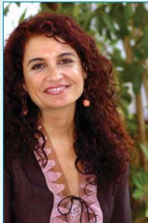
Consejera M a Jesús Montero.

Esto, sin duda, tiene mucho que ver con las objeciones que algunos profesionales ponen ante la posibilidad de firmar contratos temporales de corta duración en localidades muy alejadas de su residencia algo que, en la práctica, hace difícilmente viable asumir unas propuestas de los llamados “contratos-basura” que tienen, además, el añadido de unos hándicaps en forma de distancia y duración.