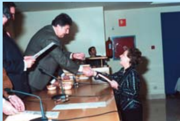
Imágenes de la entrega de diplomas.