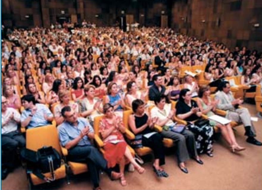
Los más jóvenes sufren el problema del paro.

Ante este panorama, los Colegios entendieron que, frente a semejante opinión, debía deberse al desconocimiento ante la realidad que, de forma tozuda, habla de muchos miles de diplomados en una situación harto delicada en cuanto a ocupación laboral. Desde el Colegio de Sevilla se añadió algo que, cualquier colegiado entiende a la perfección: “Entre los parados hay dos niveles muy diferenciados. A saber: aquellos que solo trabajan durante los periodos de Navidad y verano, sustituyendo a los fijos, y los que, directamente, no trabajan en todo el año. Se entiende que un amplio sector de la profesión no tenga mas remedio o salida que interesarle cualquier oferta del extranjero donde, además, se les considera económica y profesionalmente mucho mas que en su propia casa”.