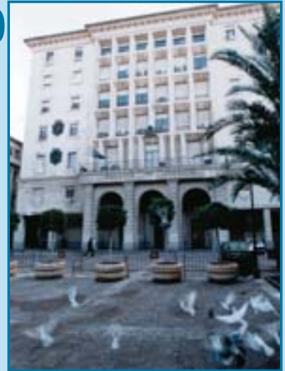
Palacio de Justicia de Sevilla

E l artículo 45 del texto refundido de la Ley General de la Seguridad Social, aprobada por Decreto 2065/1974 de 30 de mayo, establecía en su apartado 2 lo siguiente: Sin perjuicio del carácter estatutario de dicha relación (entre entidades de la Seguridad Social y personal estatutario a su servicio) la Jurisdicción de Trabajo será la competente para conocer las cuestiones contenciosas que se susciten entre las entidades Gestoras y su personal.