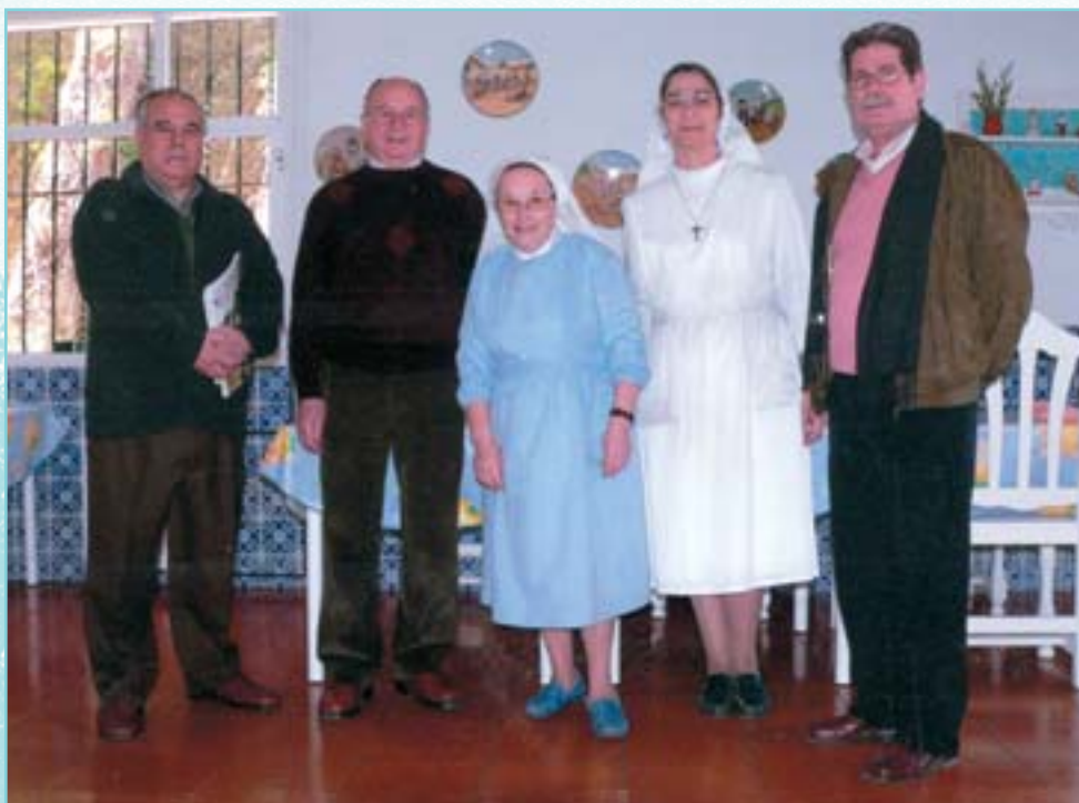
Directivos del Colegio en la Institución benéfica Regina Mundi.

El Regina Mundis acoge a 34 enfermos que tienen en común su orfandad ante la vida. La Institución, por boca de su responsable, “no pretende tener mas internos porque, primero, no hay sitio para mas y porque aspiramos a mantener el ambiente familiar, aquí no hay número en las habitaciones... ¿el requisito para ingresar? Estar abandonado, ser de aquellas personas que no quieren en otros lugares, que no tengan recursos económicos, en fin, tal que así es nuestro planteamiento social y sanitario”.