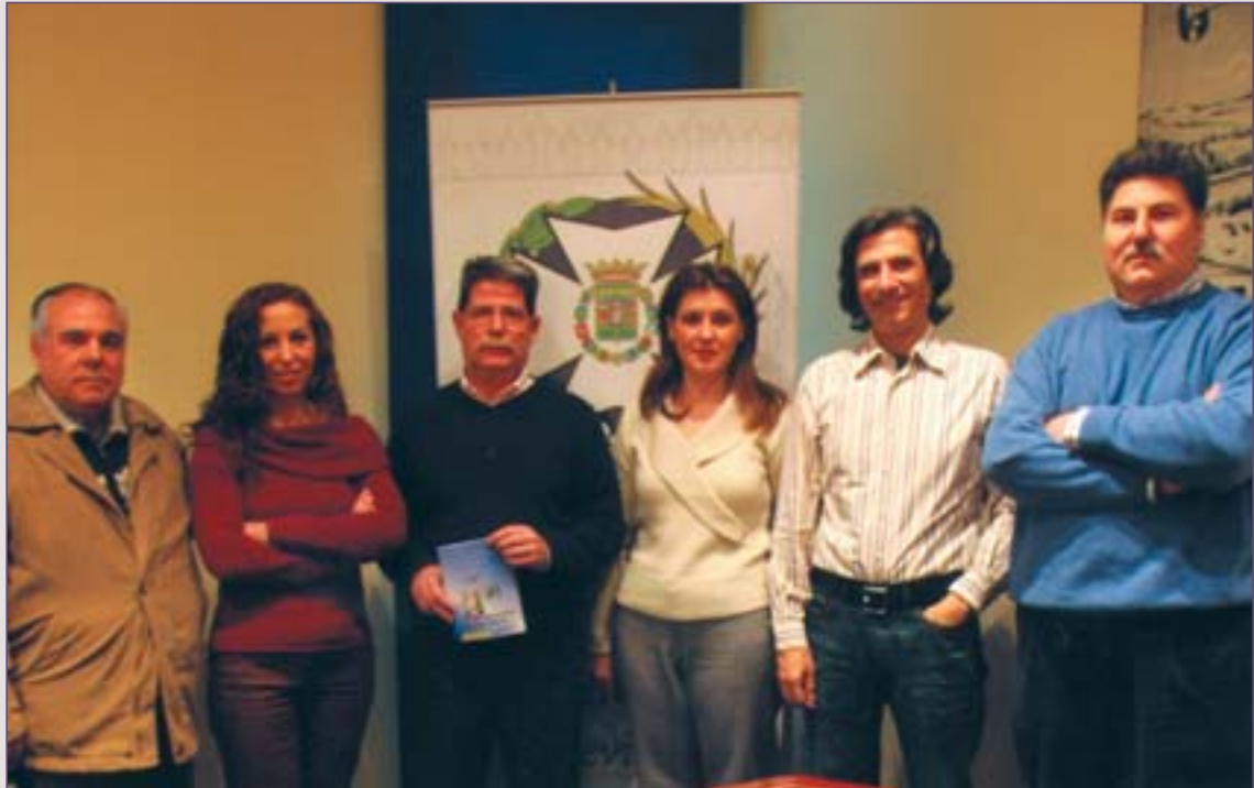
Los autores de la Guía, con directivos del Colegio.

Un equipo de enfermería sevillano acaba de poner en circulación la "Guía para el trasplante renal". Editada por la Comisión de Trasplantes del Hospital Virgen del Rocío, trata de dar respuesta a las 20 preguntas más frecuentes que el paciente debe resolver una vez dado de alta médica. Los autores definen la iniciativa como "un modo de ofrecer información para evitar la angustia de los primeros momentos fuera del hospital".