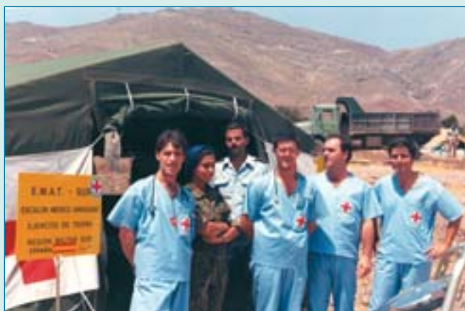
El Emat, misiones en Oriente Medio.

Eficaz, sí, es la encuesta que hace pública el Satse en donde se pone de relieve que los profesionales españoles están "desmotivados y frustrados" por mor de toda una batería de carencias que en ella se exponen. A saber: baja retribución, inadecuada a la responsabilidad cotidiana, enorme presión asistencial, ausencia de carrera profesional y un largo etcétera que, a la vista de los años sucesivos, parecería que, quince o veinte años más tarde, podría repetirse casi punto por punto en cuanto a sus conclusiones. La prensa nacional se hizo eco de esa radiografía de una enfermería casi siempre bajo mínimos.