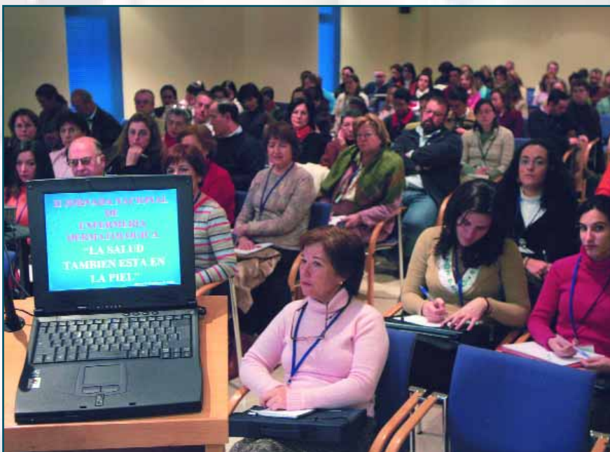
La Jornada llena de resultados

Por fin, el propio Moreno-Guerín abordó "la piel del anciano" desde la premisa del envejecimiento que afecta a todo el organismo, piel incluida, aunque con "importantes diferencias entre individuos que ponen de manifiesto la relación entre factores de edad, hereditarios y de estilo de vida". La piel, subrayó, "es el órgano mas accesible del organismo y, a su vez, el mas expuesto a los agentes ambientales cuyos efectos acumulativos son proporcionales al discurrir del tiempo" y concreto que "existe certeza de que la luz ultravioleta es el principal agente determinante externo del envejecimiento de la piel".