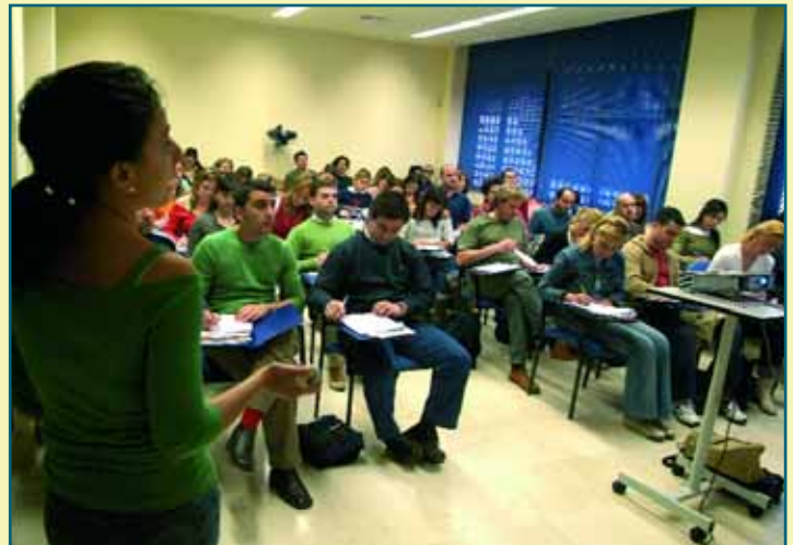
El Experto, de nuevo en el Colegio

único grupo pero las inscripciones obligaron a ajustar el espacio físico compatible con el resto del programa docente del Colegio, hasta ver configurados el número máximo que nos permiten las aulas. Esto quiere significar una indudable confianza en esta nueva apuesta de formación post-graduo a cargo del Colegio en base a los criterios que siempre perseguimos: rigor y solvencia en cuanto a profesorado y material docente".