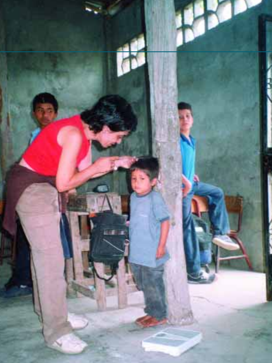
Cooperante con la ONG colegial en una aldea de Ecuador