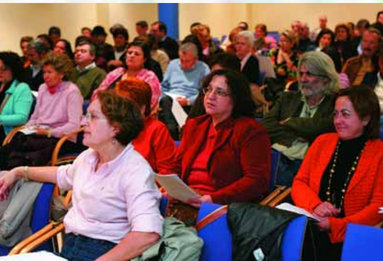
Asistentes a la primera reunión informativa

E l Colegio Oficial de Enfermería de la provincia de Sevilla anuncia un importante logro para una buena parte del colectivo: el proceso de nivelación para convalidar el título de Ayudante Técnico Sanitario por el de Diplomado Universitario en Enfermería (DUE) está en marcha. Las principales novedades de este último proyecto se refieren, principalmente, a la gratuidad del Curso y que no se hará obligatorio un examen final. Las fechas y desarrollo de estos cursos estará condicionada al número de colegiados que soliciten su inscripción. Se estima en unos 380/400 los titulados como ATS ejercientes en la provincia.