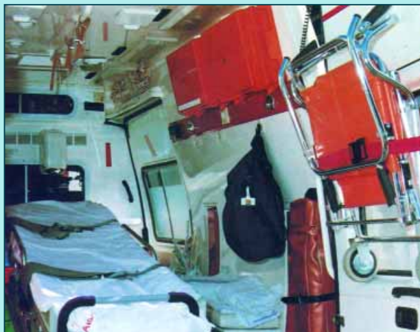
Negativa del 061 a ser empresa pública

Quienes sí cumplieron sus promesas fueron los miembros del Consejo General de Enfermería que, al 28 de junio, tomaban posesión de sus cargos luego de las elecciones del pasado día 5 del mismo mes y que supusieron la reelección, por tercera vez, del