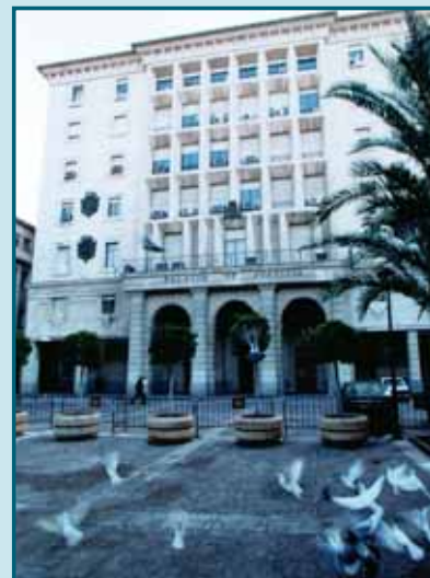
Palacio de Justicia de Sevilla

obstante, el Juzgado limitas las mismas a una tercera parte de la cuantía del proceso.