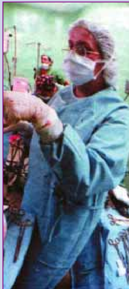
Enfermera de quirófano

En el Sistema público sanitario andaluz trabajan unos 80.000 profesionales, de todos los niveles y categorías, de los que unos 19.300 se beneficiarán en una primera medida correspondiendo a los que el SAS tiene registrados como licenciados y diplomados con