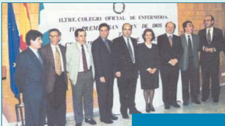
Los premios del Colegio, en 1996