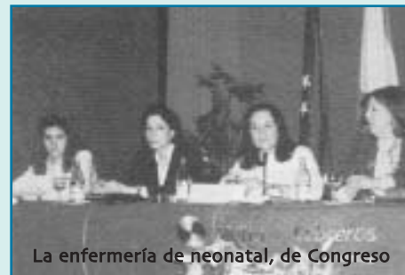
La enfermería de neonatal, de Congreso

La respuesta desde Bruselas no se hace esperar: la CEE procede a requerir al Gobierno de España por el incumplimiento reiterado de las directrices que afectan a la profesión de Enfermería que, de una vez por todas, debe estar homologada ante el resto de la Europa a la que pertenecemos. En Bruselas conocen, de primera mano, que las carencias denunciadas por el responsable del Consejo tienen su origen en que el Gobierno de Felipe González no está prestando, demasiada atención a una profesión cada vez más demandada por los