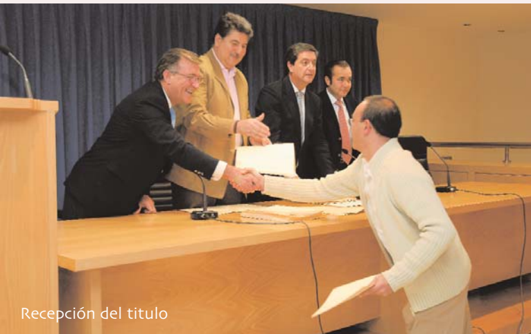
Recepción del título

El Colegio de Enfermería de Sevilla, como se sabe, es una entidad legalmente autorizada, y con carácter indefinido, por la Consejería de Empleo de la Junta de Andalucía para desarrollar este frente docente en sus tres especialidades. En virtud de esta misma competencia, que el Colegio durante mucho tiempo luchó por conseguir, el curso en cuestión estuvo abierto tanto a personal de Enfermería (la gran mayoría de la promoción) como de otras titulaciones universitarias. De hecho, entre los nuevos Técnicos Superiores figuran titulados en las diplomaturas de Magisterio y Relaciones Laborales así como licenciados en Medio Ambiente.