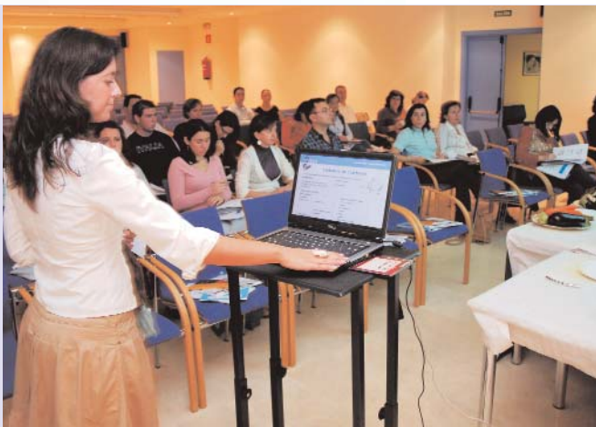
Teoría de la nutrición inteligente

los hidratos de carbono y el tipo de cocción de los alimentos fueron puntos relevantes de la jornada antes de que los alumnos tuvieran que escribir un menú por ellos consumido un día cualquiera y, sobre él, valorar "su equilibrio nutricional". La elaboración de tres platos únicos, tanto de manos de un cocinero como, a continuación, por los asistentes sería uno de los lugares con mayor interés.