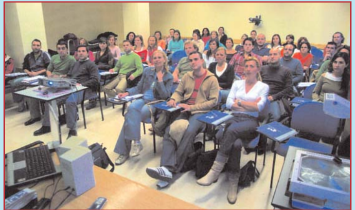
Afluencia masiva en el Colegio

Este hecho, mantenido a través de los meses de 2006, ha merecido una reflexión por parte de la Junta de Gobierno responsable de la institución cuyo portavoz resumía el récord de altas como "la expresión de que, pese a todas las circunstancias que han habido en los últimos tiempos, el Colegio se ha consolidado como un referente para quienes, vía titulación o cambio de residencia, deciden iniciar la práctica profesional en cualquier lugar de nuestra