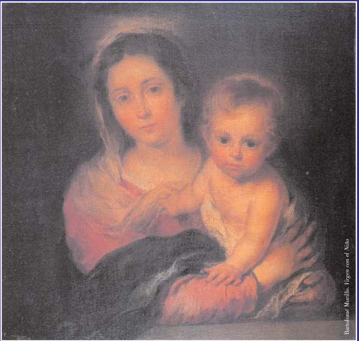
Bartolomé Murillo. Virgen con el Niño

El Colegio de Sevilla desea una Feliz Navidad a toda la Profesión de Enfermería