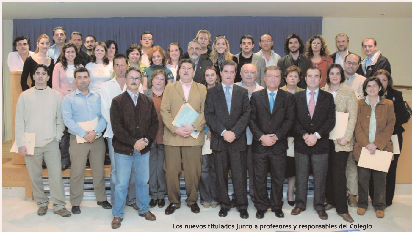
Los nuevos titulados junto a profesores y responsables del Colegio