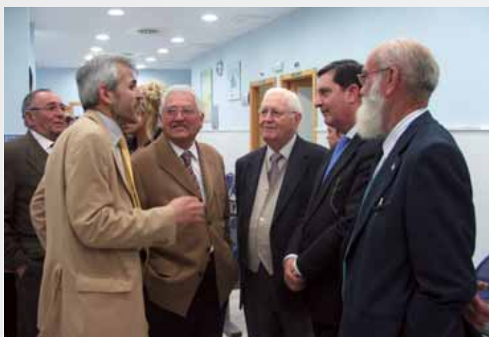
Interior de la nueva instalación