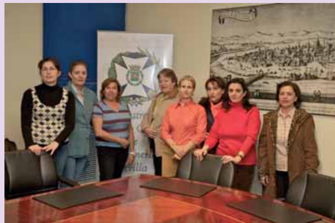
Matronas sevillanas en el Colegio

LÚDICO: el 18/Mayo en el Hotel ABBA de Triana a partir de las 21,00 horas. (cena, baile, barra...). Inscripciones en la secretaría del Colegio. Precio: 35 euros).