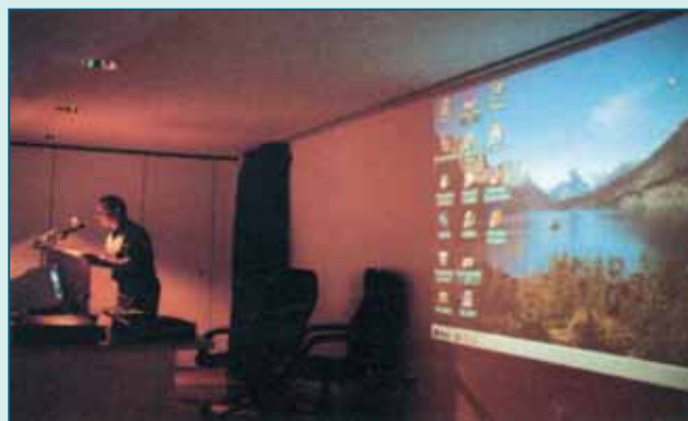
Se presentó la Sociedad de internet

De Alzheimer habla el orbe científico al conocerse que la Academia de Suecia ha decidido conceder el Premio Nobel