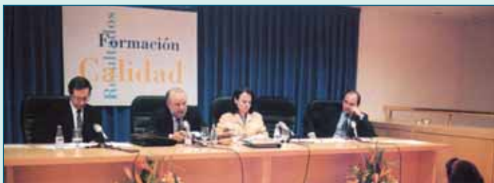
Jueces-magistrados, en el Colegio

Una mayoría que, en otro orden de cosas, no duda en aplaudir la iniciativa del Campamento que la Orden San Juan de Dios sigue promoviendo en Sanlúcar de Barrameda para que los niños y jóvenes que, durante todo el año, residen en la Ciudad de Alcalá de Guadaíra puedan