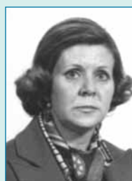
Paula Salvador Martín Santa Ana la Real (Huelva)