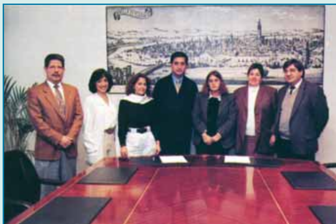
Acuerdo con Aspanri