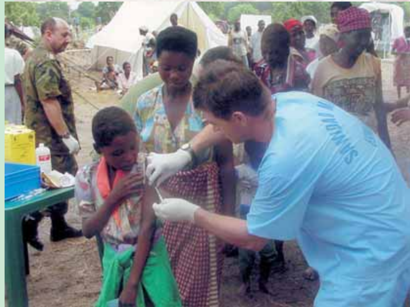
Enfermería militar en una misión humanitaria

cialidades de armas o cuerpos. Dicho en otras palabras, la enfermería militar tiene su techo en el grado que Teniente Coronel mientras, por ejemplo, un Ingeniero técnico puede llegar a coronel y, si fuera posible, General. Lo cual equivale a que estamos abocados a una discriminación.