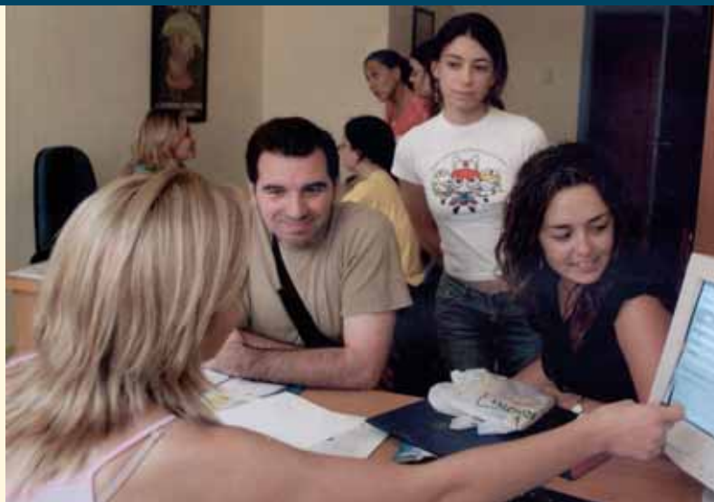
El dispositivo del Colegio, atención y resultados

Por lo mismo, no está de sobra confirmar que el citado Dispositivo continúa abierto y la confirmación añadida es que, en los últimos meses, viene recibiendo una gran afluencia de peticiones en cuanto a información y vías de tramitación por parte de los profesionales de Enfermería sevillanos. Desde el mismo dispositivo se confirma que la especialidad de Enfermería Médico-Quirúrgica es la que recibe el mayor número de solicitudes de tramitación seguida de la Comunitaria.