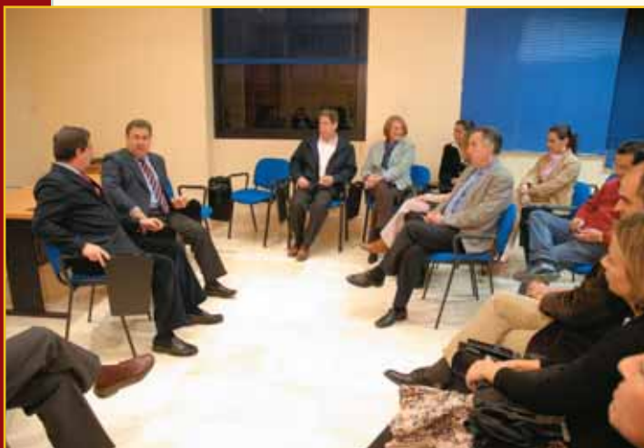
Directivos del Colegio junto al candidato popular

Por su parte, el Colegio le hizo llegar las principales cuestiones que, en la actualidad, afectan y preocupan a la Enfermería, tales como la parálisis que se observa en el desarrollo de las especialidades, el empleo precario y la necesidad de aumentar "la ratio entre enfermeras/población para que, si se alcanzan unos niveles medios, el ciudadano recibiría una atención de la mayor calidad y, a su vez, la profesión de Enfermería no conocería en absoluto el problema del paro que ocasiona, en numerosos casos, la nada deseable emigración, sea hacia otras provincias españolas o, por desgracia, lejos de nuestras fronteras, especialmente a naciones como Portugal, Reino Unido, Francia e Italia". Ambas partes, como sucediera en la citada visita del candidato por el PA, prometieron volver a tener nuevos encuentros de los que, "sobre todo, salgan soluciones que afecten y aporten beneficios tanto a la sociedad en su conjunto como a la Enfermería como agente sanitario".