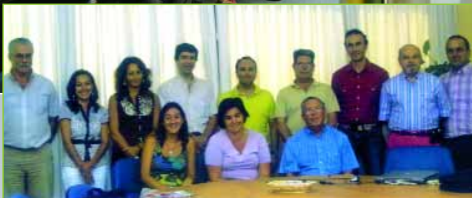
Inauguración y Profesorado de la Escuela

de 45.000 colaboradores, están presentes en los cinco continentes, en 50 naciones con hospitales, salud mental, Educación Especial, Intervención integral de la vejez; rehabilitación psicosocial de transeúntes, atención a enfermos con SIDA, tóxicodependientes y un largo etcétera... sin olvidar las facetas docente e investigadora".