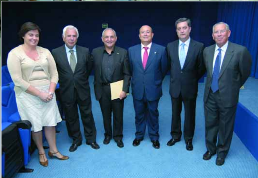
La Inauguración contó con el respaldo de las autoridades municipales, académicas y sanitarias