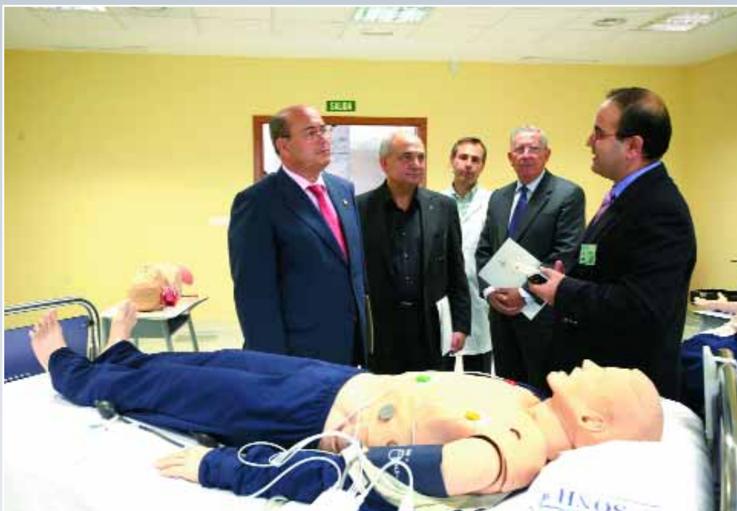
El rector de la Hispalense recibe explicaciones de los profesores de la Escuela