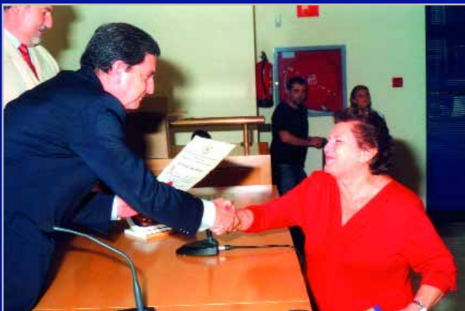
Imágenes de la entrega de distinciones