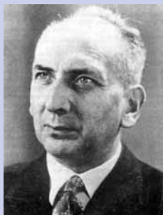
Dr. Karel, padre de la celiacía

A la hora de trazar una línea histórica sobre esta dolencia que se manifiesta como una intolerancia permanente a la proteína del gluten, forzosamente hay que citar un nombre: Willem Karel Dicke. La figura de este médico nacido en Holanda (1905) supone tanto como asegurar, al decir de los mas expertos en el tema, un antes y después en el devenir de la enfermedad celiaca. Cierto que ya en años anteriores al nacimiento de Jesucristo, Areteo de Capadocia dejaba constancia expresa de la existencia de personas a las que afectaba de alguna manera la ingesta de determinados cereales. Pero tuvieron que pasar los siglos hasta que el doctor Karel, comenzase a investigar sobre este problema de serias alteraciones digestivas que afecta, aproximadamente, a 1 de cada 1.000 nacidos.