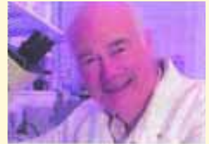
Martin J. Evans

L a academia Sueca decidió que el Premio Nobel de Medicina de 2007 fuera para tres investigadores que han sido pioneros en manipulación genética en ratones. Sus nombres: Mario Capecchi (nacido en Italia 1937), Martin J. Evans (Gran Bretaña, 1941) y Oliver Smithies (Gran Bretaña, 1925) son tres prestigiosos científicos que han empleado años en modificar los genes en ratones como paso esencial para averiguar el origen y el desarrollo de numerosas enfermedades humanas, tales como la fibrosis quística, la diabetes, el cáncer o los problemas cardiovasculares.