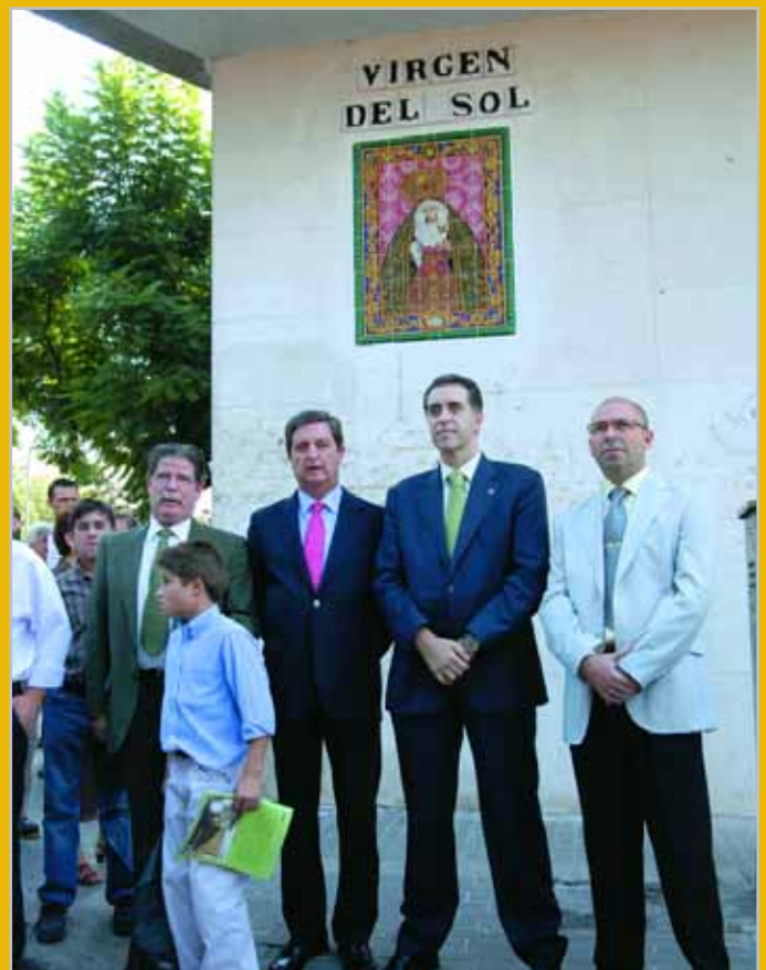
Colegio y Hermandad del Sol, acto vecinal