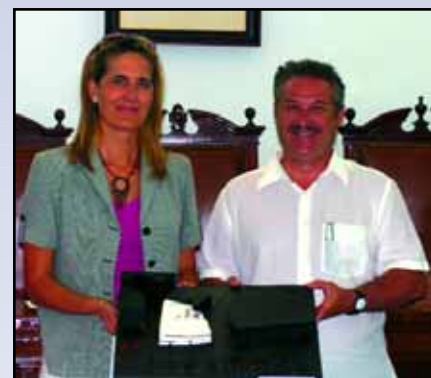
La Alcaldesa de Osuna y el Presidente de los arquitectos sevillanos

Hasta la fecha, diez han sido los Colegios Oficiales que han expresado su deseo de instalarse, como sedes comarcales, en el futuro edificio. Las primeras corporaciones en manifestar su conformidad han sido las correspondientes a estas profesiones: Ingenieros Industriales, Ingenieros Agrícolas, Médicos, Enfermería y Arquitectos. Las obras del nuevo edificio resultante al Proyecto Iulia, está previsto se inicien antes de que finalice 2007 y estará ubicado en la Avenida de la Constitución, donde se encuentra la Residencia Universitaria de Osuna. Tendrá dos plantas mas un sótano y dispondrá de aulas para la realización de cursos y conferencias así como otros espacios comunes y de archivo.