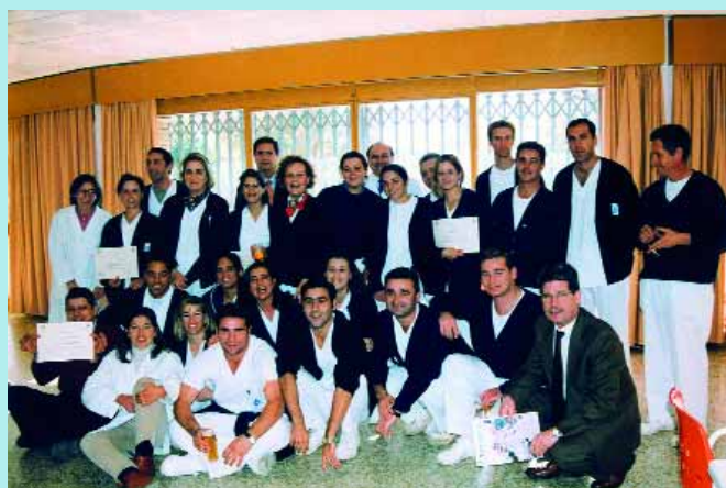
Curso para personal del hospital S. J. de Dios

En la profesión, por otra parte, empieza a existir un creciente temor ante algunas particularidades del futuro Estatuto-Marco por el que viene suspirando el conjunto de profesiones sanitarias. Este proyecto se encuentra, actualmente, en fase de borrador pero, con todo, ya existen voces que denuncian algo tan "sensible" como que en el apartado de la "movilidad del personal" se contempla que pueda ser algo con carácter forzoso. Lo cual provoca, de inmediato, severas críticas tanto por parte de los Colegios Ofi-