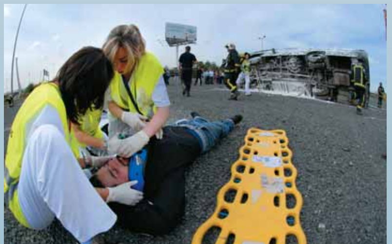
Plataforma en defensa del Militar