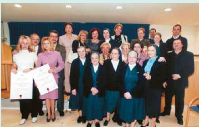
Premios del Colegio en 2001

Para iniciar la primavera, pocas cosas mejores suceden que la entrega de las distinciones anuales convocadas por el Colegio. El Premio San Juan de Dios y el Certamen Nacional de Enfermería Ciudad de Sevilla siguen acumulando años de vida y, en esta oportunidad, en el apartado que evoca al Patrón de la profesión, el honor va con destino a una de las mejores manos posibles: las Hermanas de la Caridad (muchas de ellas también enfermeras) que rigen el Comedor benéfico San Vicente de Paúl, ubicado en El Pumarejo.