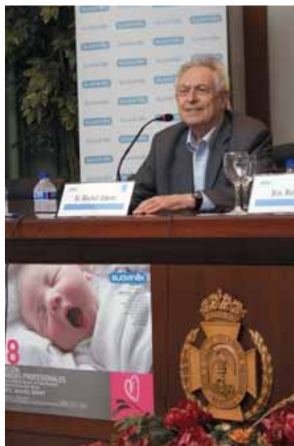
Michel Odent, figura mundial de la obstetricia

Este médico francés otorga una importancia vital al periodo perinatal encaminado a adquirir una "capacidad de amar, sea amarse a sí mismo o amar a otros" y de cómo esta fase ha sido objeto de un clara baja estimación hasta relativamente hace poco tiempo. El prestigioso obstetra, introductor hace cuarenta años en los hospitales públicos de Francia del parto en el agua, precisó que los fisiólogos son los