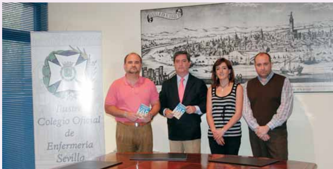
El Vademécum, presentado en el Colegio

De carácter pionero, contiene la descripción, análisis y comentarios de 3.000 productos