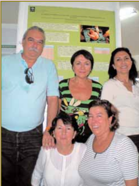
Póster sobre "Parto en hospitales públicos..." con sus autores

En cuanto a los asuntos legales mas atractivos y que estuvieron presentes en este Congreso, destacaríamos los referidos a la Ley antitabaquismo y las motivaciones para evitar sus efectos tan perjudiciales en la población general y, mas en concreto, en la mujer embarazada y en los niños, sea de forma activa o, por supuesto, pasiva. Sin olvidar la ya larga polémica que rodea a la "prescripción enfermera como consecuencia de la promulgación de la Ley del Medicamento" y un apartado para el "alcance jurídico del consentimiento informado en la asistencia obstétrica".