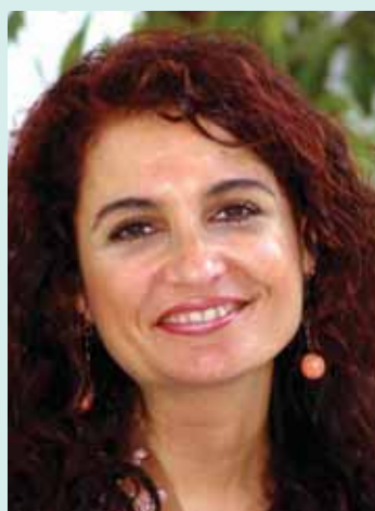
Vallejo da la alternativa a Montero

supuesto, con los numerosos ayuntamientos que han visto remodelados sus mapas de atención primaria a golpe de decreto.