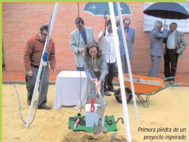
Primera piedra de un proyecto esperado

L a Asociación Autismo Sevilla está de enhorabuena. La primera piedra de su futura Unidad de Estancia Diurna para los enfermos de la provincia fue colocada en el transcurso de un acto cargado tanto de sencillez como de emoción por lo mucho que representa. Los 900 metros cuadrados de que consta este proyecto han nacido con la esperanza de ver consolidadas tantas ilusiones como los responsables de la Asociación llevan acumulados desde hace tiempo.