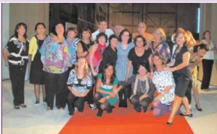
La representación de matronas de Sevilla, en el Congreso alicantino

Otro lugar de encuentro fue la exposición acerca de la "Controversia de la vacuna HPV" al contemplarse