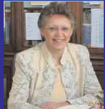
Barré-Sinoussi y Montagnier

Sin embargo, los prolegómenos de la I Jornada no fueron del todo halagüeños: "Cuando llegó el verano de 1985, a tres meses de las Jornadas, estábamos preocupados porque las inscripciones eran escasas. Sin embargo, contamos con otro hecho salvador: Sucedió que el actor nor-