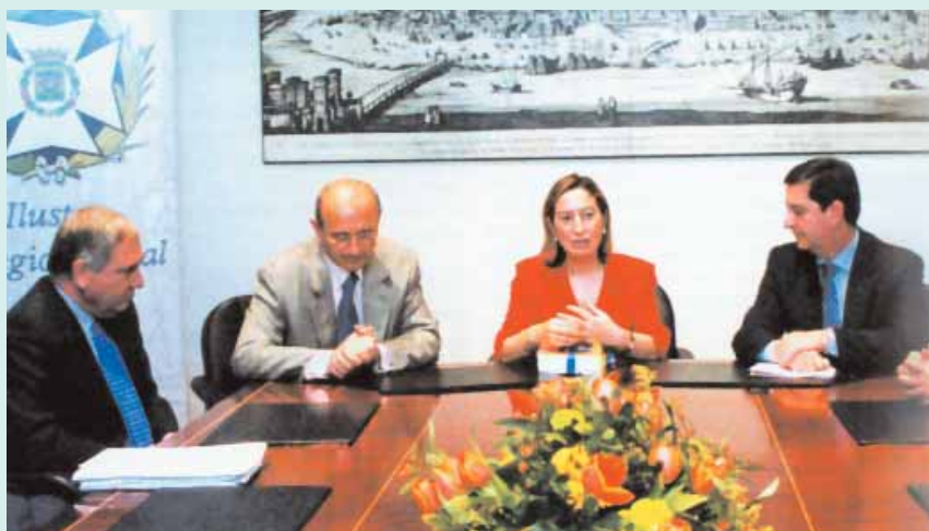
La ministra Ana Pastor, visitó el Colegio de Enfermería de Sevilla

julio de este año cuando los médicos daban un alta a una mujer residente en San Fernando (Cádiz) que no era, precisamente, una alta más sino la última de la larga historia del Vigil de Quiñones. A partir de ahí, el Militar se convertirá en un "coloso en silencio" como lo han definido sus propios trabajadores que el SAS hace enmudecer en pleno agosto cuando no hay presión asistencial ni de opinión por medio. El acuerdo final entre el Ministerio de Defensa