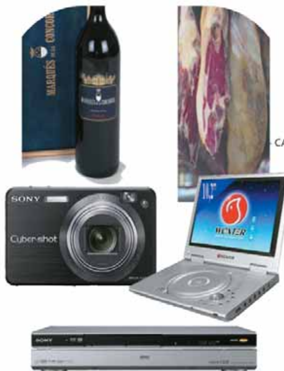
CAJA DE VINO CON DOS BOTELLAS MAGNUM