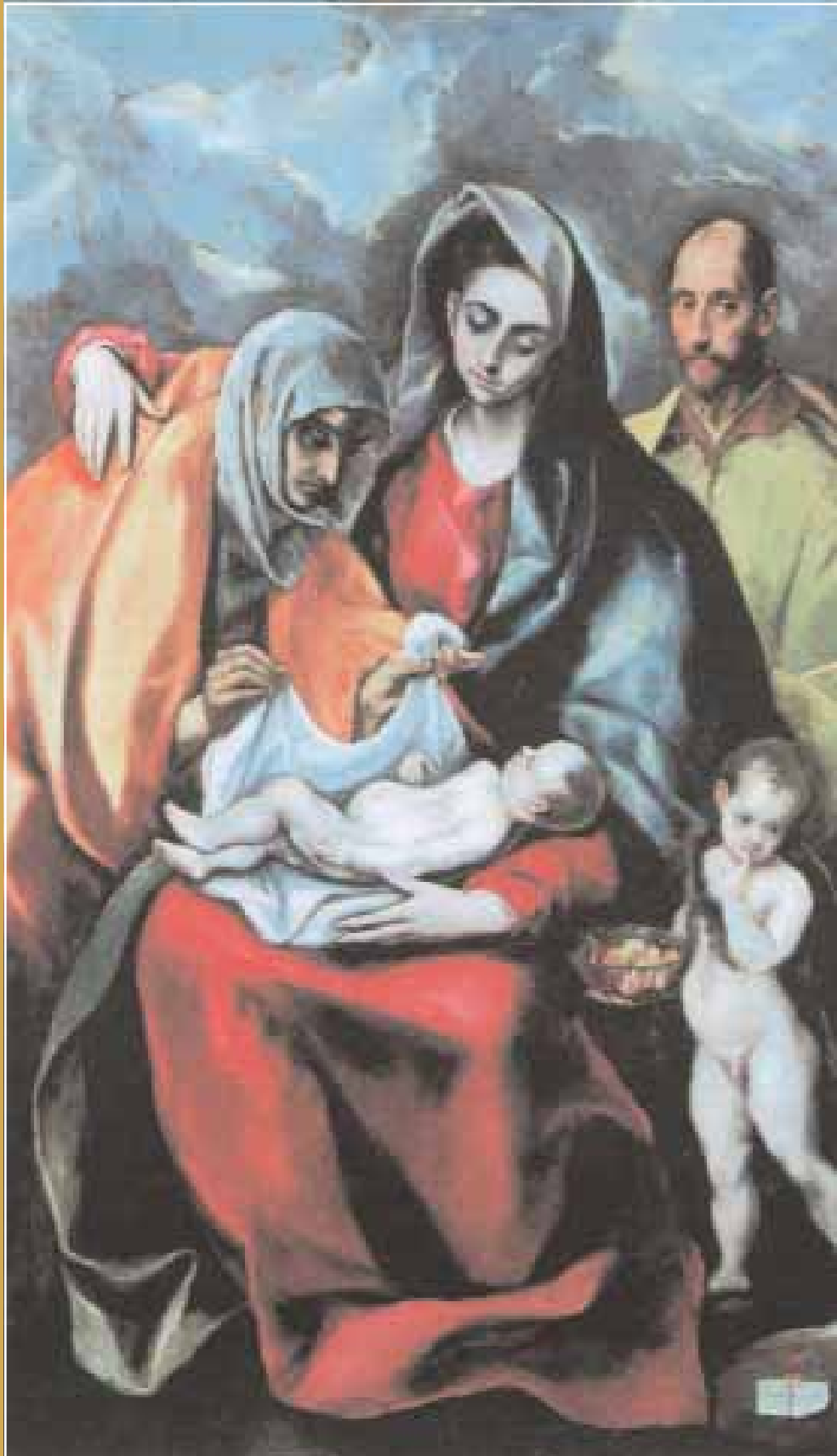
La Sagrada Familia. El Greco (1590)

Colegio de Enfermería Sevilla Con nuestros deseos de Paz y Felicidad