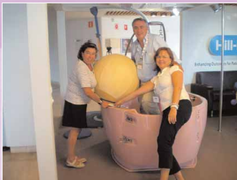
Recursos para el parto mas natural