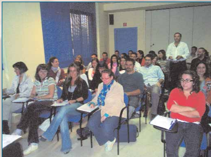
El centenar de inscritos en el Experto comenzó las enseñanzas

con el futuro título de Grado y su posterior vía de acceso a niveles superiores. En este Experto se contempla un extenso programa de 250 hora lectivas (o lo que es igual: 25 créditos) que se irán realizando semanalmente hasta alcanzar su conclusión, en forma del espectacular Simulacro, algo que tendrá lugar allá por el próximo mes de mayo de 2009. Hasta entonces, las cien enfermeras y enfermos sevillanos, ahora en su condición de alumnos del Experto, se adentran en las enseñanzas contenidas en los diferentes Módulos de que consta el programa y de los que ya se han impartido los dos primeros con Alfonso Yáñez y Antonio Pérez Alonso en funciones docentes.