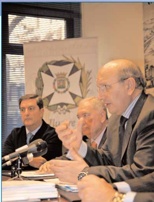
"Buscamos la seguridad jurídica del profesional"