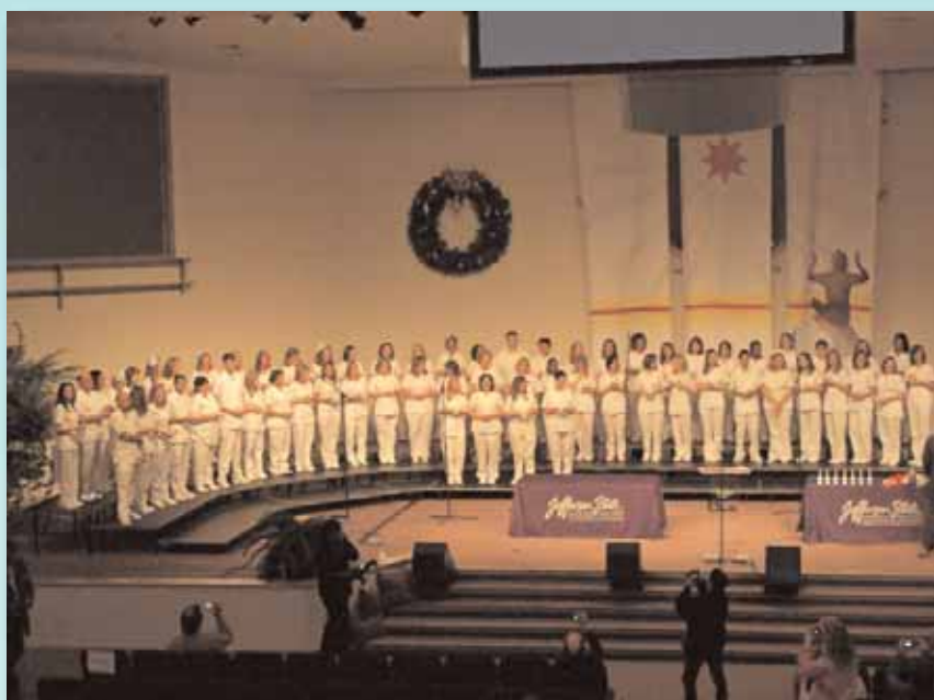
Ceremonia de graduación de la "Jefferson State..." en Birmingham, Alabama