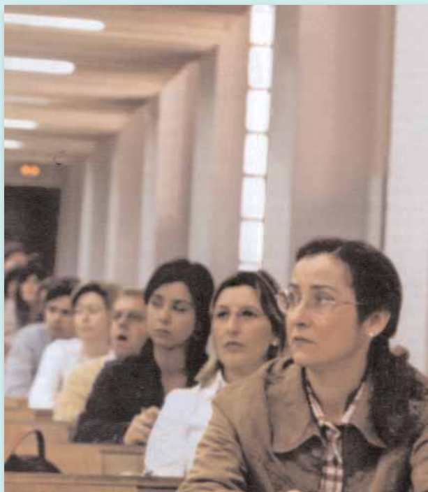
La Oposición a plazas del SAS, por fin hecha realidad

Al final, todo saldrá a pedir de boca. Así, los nutricionistas se apuntan un tanto al convocar a casi medio millar de profesionales llegados desde toda España para debatir, a lo largo de varias jornadas, aspectos sanitarios tan relevantes como la nutrición, la obesidad y las carencias que el Sistema puede llegar adolecer en relación a este campo. Los expertos lanzan una llamada de atención,