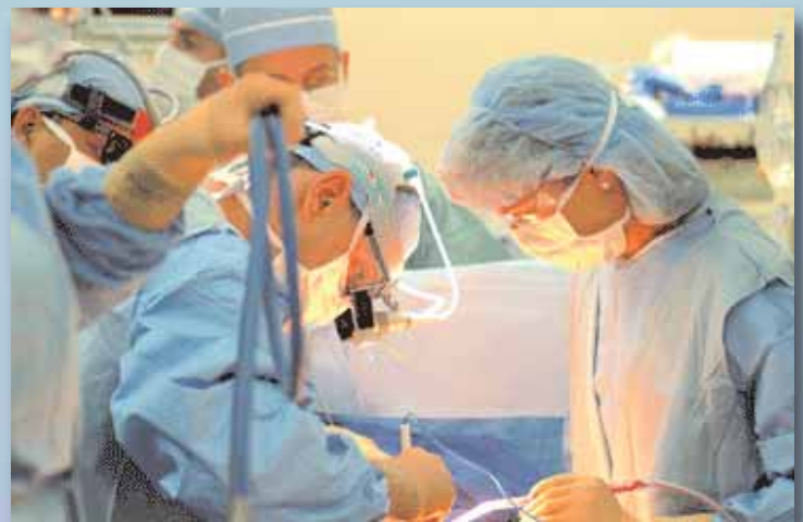
El trabajo de los profesionales y el aumento de los trasplantes