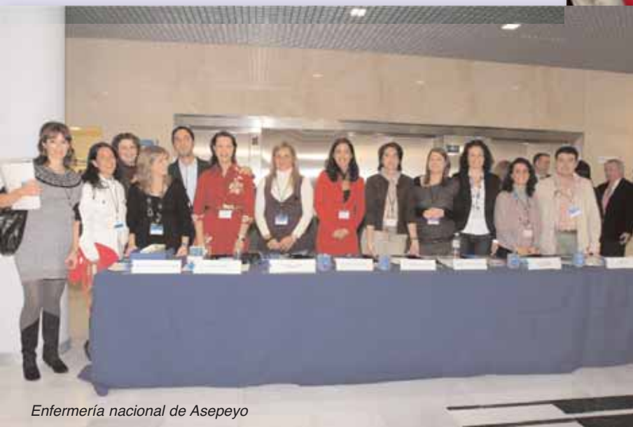
Enfermería nacional de Asepeyo

ciones en CMA que fueron llevadas a cabo en el Instituto de Salud Laboral y cuyas principales conclusiones fueron: