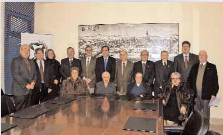
Directivos junto a quienes cumplen 50 años de vinculación colegial