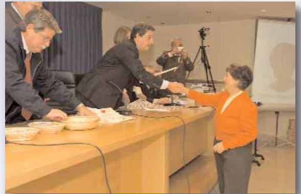
Reconocimiento del Colegio

En la tradicional entrega de distinciones a los nuevos colegiados de honor, los que acaban de acceder a la jubilación, hay un apartado en verdad especial cual es el reconocimiento para quienes han alcanzado las bodas de oro con el Colegio. Dicho de otra forma: aquellos profesionales que iniciaron su andadura en el ya lejano año de 1958 y han mantenido su vinculación con la corporación. El Colegio volvió a convocar a los afortunados protagonistas de tan auténtico récord porque medio siglo les contemplan, entre las dos épocas como trabajadores en activo y el periodo que actualmente viven como jubilados.