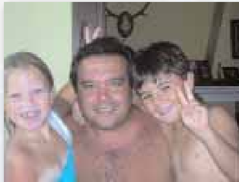
"Entre nosotros, estos niños bielorusos ven alargar su vida"

sus cuerpos y fortalecer sus órganos. Con nosotros, con un ambiente limpio y comida libre de contaminación, se prolonga la esperanza de vida de estos niños entre un año y medio y dos años. Pero también es importante decir que ninguno de los posibles males derivados de la radiactividad es contagioso". Todo para tratar de paliar aquella catástrofe considerada como la mas grave nuclear de la historia de la humanidad, que obligó, de inmediato, a que 400.000 personas abandonaran sus hogares y que lleva contabilizados (entre los años 1986–2004) 200.000 muertes porque el material radiactivo liberado fue 500 veces mayor que la bomba atómica lanzada sobre la ciudad de Hiroshima.