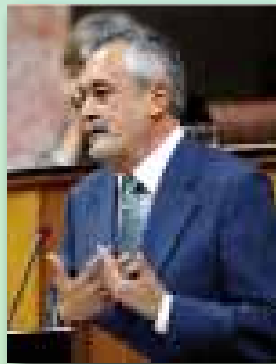
José Antonio Griñán. Presidente de la Junta de Andalucía

José Antonio Griñán (Madrid, 1946) se ha marcado un claro objetivo para la actual legislatura. En su primera comparecencia parlamentaria dejó sentado que la Cámara conocerá una nueva Ley de Salud Pública para la región partiendo de la base de que el actual Sistema Sanitario "uno de los