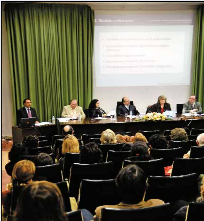
Tribunal y público asistente a la lectura de la tesis