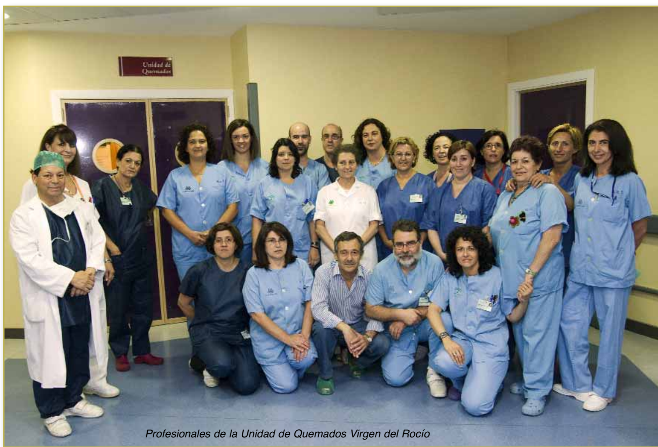
Profesionales de la Unidad de Quemados Virgen del Rocío

El Colegio de Enfermería de la provincia de Sevilla, a través de un Jurado constituido al efecto, designó como Premio San Juan de Dios en su decimosexta edición, a la Unidad de Quemados del Hospital Virgen del Rocío. En una decisión calificada como de "unánime y sorprendente", el galardón que evoca la figura del creador de la enfermería ha recaído en un lugar de atención escasamente conocido aunque sí muy valorado socialmente. En la Unidad se ha recibido la noticia de forma "satisfactoria" porque