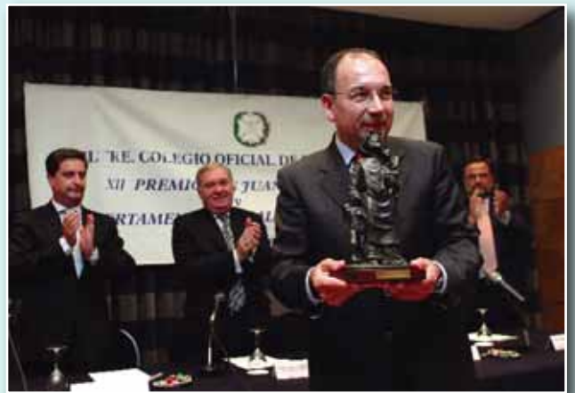
Premio S. J. de Dios a los Trasplantes del SAS

11-M no acabe, en absoluto, de difuminarse. Y si esta noticia no fuera del todo importante, a reglón seguido del calendario aparece el tribunal constitucional al decir que no admite el llamado plan Ibarreche o forma propuesta por el presidente vasco para la independencia. Esta decisión del TC ocupa muchos más espacios en las noticias que el anuncio hecho por el director del centro nacional de Trasplantes y medicina Regenerativa, Rafael Matesanz, en el sentido de que España va a disponer, a corto plazo, de cuatro centros para la investigación en células madre: situados en Madrid, Barcelona, Granada y Valencia.