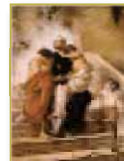
Imagen de San Juan de Dios salvando de las llamas a niños ingresados