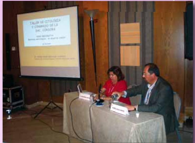
La vocal matrona del Colegio, en el Taller

El Congreso, celebrado en un hotel del Córdoba, se inauguró con una conferencia inaugural a cargo del Defensor del Pueblo Andaluz, José Chamizo de la Rubia, quien habló sobre "Las mujeres ante el Defensor Andaluz". Acto seguido, y tras ser entregado a Milagrosa Guerrero el Premio de Andalucía de Anticoncepción, comenzó el programa