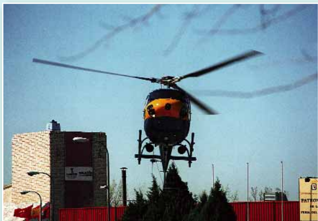
Conflicto de competencias en el transporte sanitario

Pero no todo son parabienes en la profesión. El Consejo General de enfermería no ha dudado en denunciar, públicamente, la aparición de un Real Decreto por el que se concretan las cualificaciones de determinados puestos de trabajo, entre ellos los de técnicos de formación profesional, en el campo del transporte sanitario. El Consejo General entiende que, con la presente normativa en la mano, se puede "inducir al intrusismo" al serle asignadas a los técnicos competencias de cuidados y técnicas que son "de exclusiva realización por parte de los diplomadas y diplomadas de Enfermería, y además en clara incompatibilidad con lo que establece la Ley de Ordenación de las Profesiones Sanitarias (LOPS). Es claro que el mismo Consejo anuncia su voluntad de "adoptar todas las medidas legales