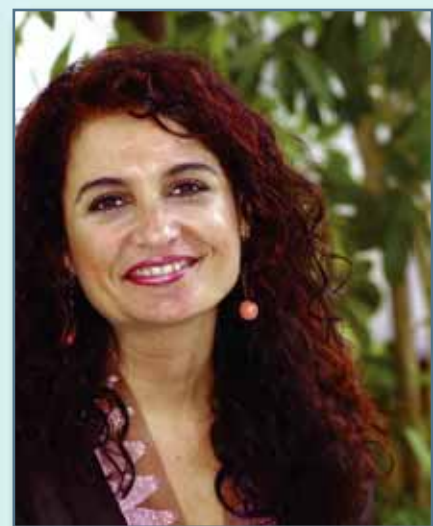
Montero, nueva Consejera de Salud

España entera sigue bajo el impacto, terrible, de los trágicos sucesos del 11 de marzo. No hay sino una enorme confusión social, máxime cuando se empieza a evaluar la auténtica dimensión de la masacre. Casi dos centenares de asesinados, dos mil heridos de distinta consideración, una investigación policial en marcha y, como telón de fondo de unas pocas horas por medio, la convocatoria de las elecciones generales.