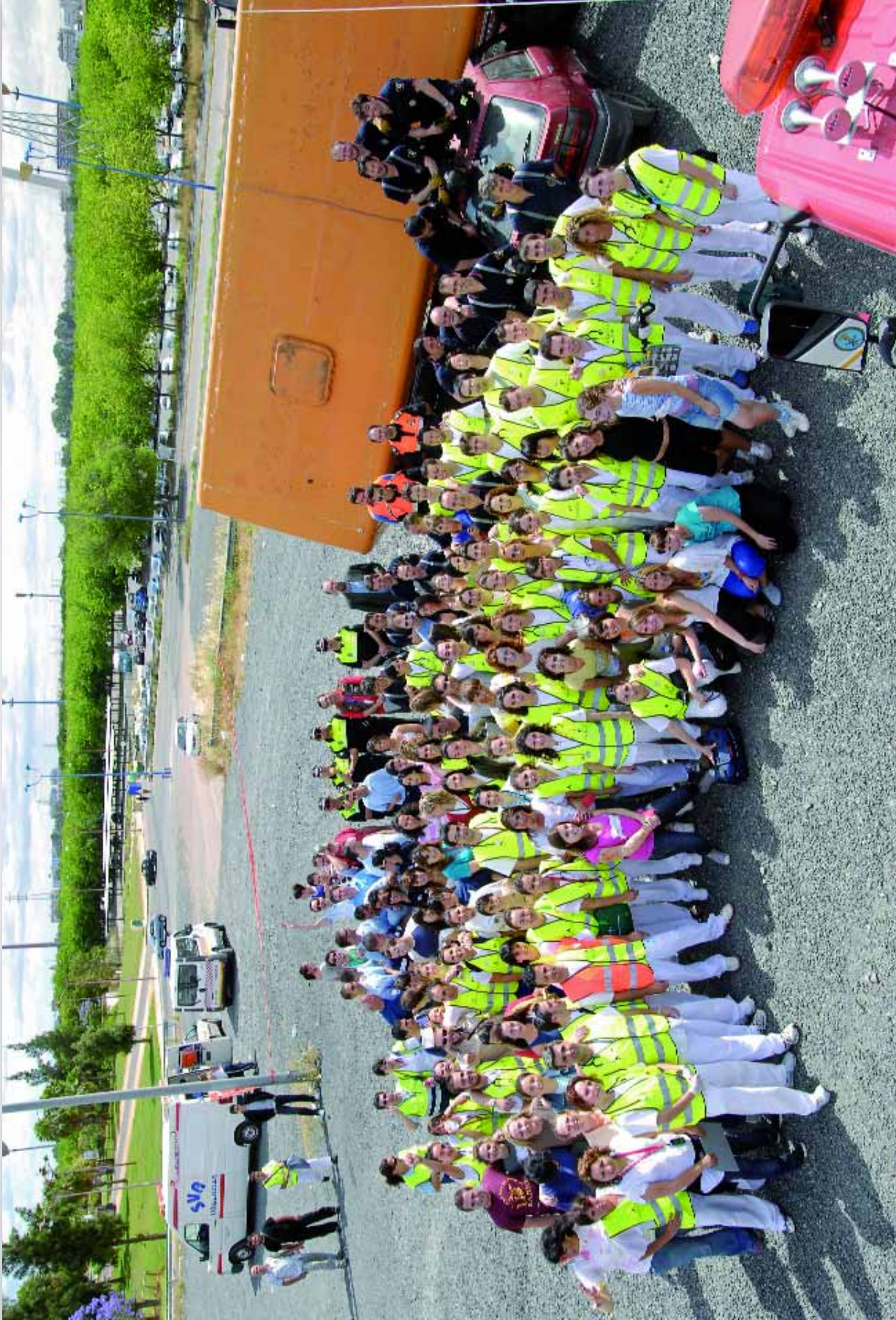
COLOFÓN.- Una vez culminado el Curso de Experto Universitario de Enfermería en el contexto de las Urgencias y Emergencias a través del simulacro, todos los intervinientes quisieron inmortalizar el momento del actiós a unas enseñanzas que van a permitirles adentrarse en este campo de actuación profesional. El centenar de jóvenes alumnas y alumnos del Curso, junto a efectivos del Cuerpo de Bomberos de Sevilla, Policía Local, Protección Civil y personal de las distintas compañías de UVI y ambulancias intervinientes dejaban para la historia de este programa docente una atractiva imagen llena de contenidos y que, a buen seguro, va a perdurar en la memoria de todos y cada uno de los aquí reunidos en la enorme explanada del Estadio de La Cartuja.