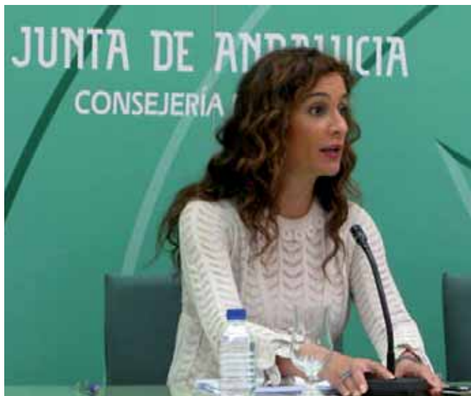
María Jesús Montero

Como segunda fase, la Consejería anuncia que "las enfermeras podrán realizar también, a través de la receta electrónica, el seguimiento de los tratamientos farmacológicos prescritos por los facultativos a los pacientes crónicos, tal es el caso de los diabéticos, con úlceras por presión o con tratamiento de anticoagulación entre otros, a través de protocolos previamente establecidos". Consecuencia de esta voluntad de la administración regional es que, como precisa la Junta, "mas de un millón de pacientes crónicos y de cuidados a domicilio se beneficiarán de la medida".