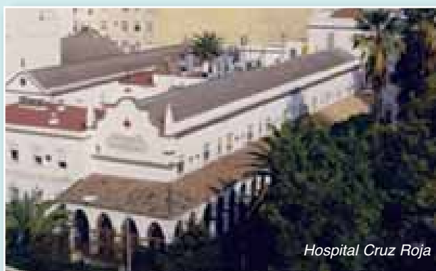
Hospital Cruz Roja

También por Sevilla, si antes se ha hablado –y de qué forma– del Hospital Militar y su cierre, también es objeto de comentario el futuro que puede aguardar a otro veterano centro sanitario: el hospital de la Cruz Roja sito en la Ronda de Capuchinos. Todo a consecuencia de que, desde su sede central en Madrid, Cruz Roja Española anuncia su voluntad de poner en venta los hospitales que mantiene abiertos y que, para esta ONG, los servicios y prestaciones que depara no son ya imprescindibles por estar el Sistema Nacional de Salud como entidad responsable. En España todavía funcionan, y con excelente rendimiento, una decena de hospitales que Cruz Roja mantiene en vigor, entre ellos el de Sevilla, que se inauguró en el año 1923 como Hospital Victoria Eugenia. Cruz Roja Española no quiere que se dilate en el tiempo este proceso de venta lo cual, obvio es decirlo, siembra de inquietud a los cientos de trabajadores de todos los niveles y categorías en los centros repartidos por prácticamente toda la geografía nacional: San Sebastián, Córdoba, Irún, Burgos, Vigo, Bilbao, Gijón, Palma de Mallorca, Oviedo y Sevilla.