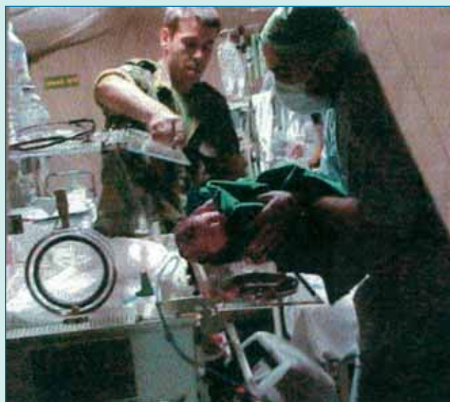
Cierre del hospital Militar de Sevilla