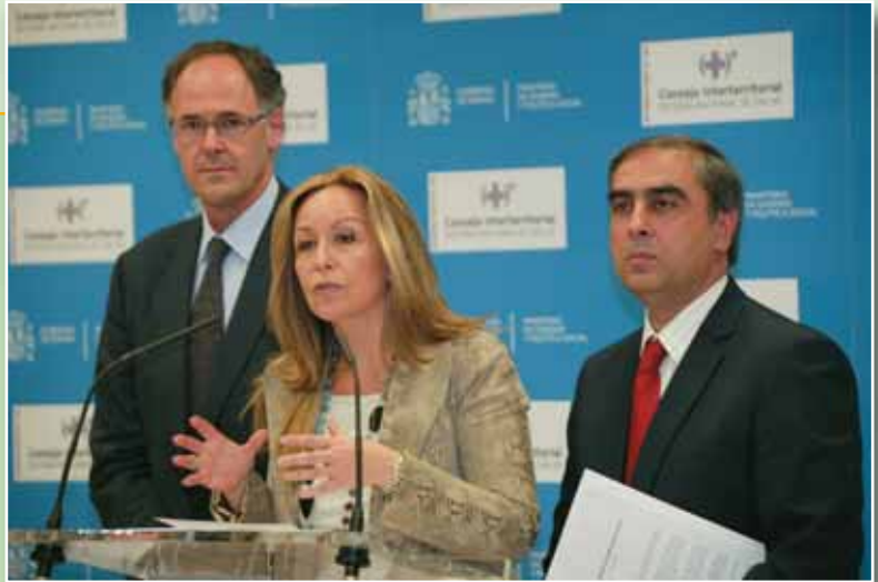
Ministra Jiménez junto a sus directos colaboradores

La gripe A presenta unos signos típicos de cualquier otro cuadro gripal: fiebre, dolor muscular, tos, cefalea, dolor de garganta, acompañada, a veces, de vómitos y diarrea. La trascendencia del nuevo