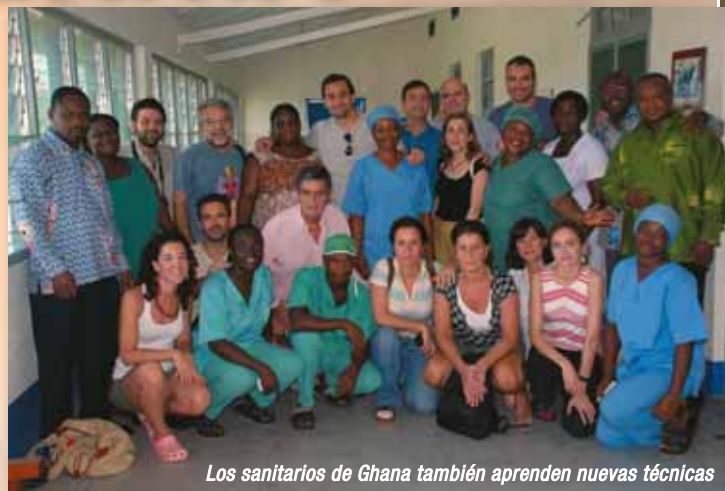
Los sanitarios de Ghana también aprenden nuevas técnicas

con un equipaje mitad personal mitad de logística sanitaria, se desplazó hasta repartirse por tres centros de Ghana (hospitales Takoradi, Gaoa y Nana) donde atendieron hasta 170 casos de "hernias gigantes que han recidivado múltiples veces". Los anónimos y ejemplares protagonistas de esta