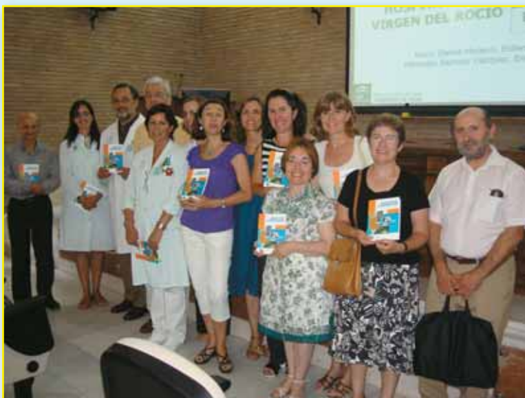
Promotores de la Guía

El Virgen del Rocío presentó su Guía para la educación en la diabetes, que cuenta con una tirada inicial de 500 ejemplares, resume cuatro años de trabajo conjunto, según indican desde el centro, entre "las enfermeras del hospital Virgen del Rocío y de los centros de Salud de Sevilla, Aljarafe y Sevilla-Sur". La obra va dirigida a mejorar la calidad de la atención que se presta a estos pacientes en base a las sesiones educativas que se llevan a cabo tanto en el hospital como en los centros de primaria las cuales han demostrado "ser un instrumento idóneo