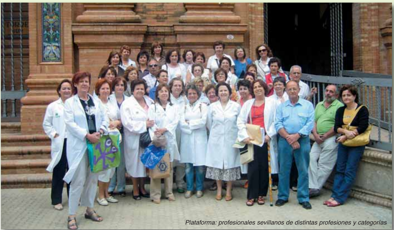
Plataforma: profesionales sevillanos de distintas profesiones y categorías

jubilación anticipada y parcial de los empleados públicos" (...) y en dicho estudio se "contemplará la realidad específica de los colectivos afectados, incluida la del personal al que es de aplicación la Ley 55/2003 del Estatuto Marco del personal estatutario de los servicios de salud".