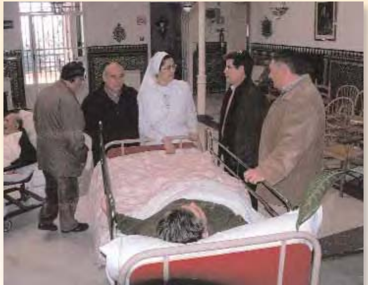
"Regina Mundis", ejemplo de vocación y solidaridad

Finalmente, la Institución benéfica "Regina Mundis" con sede en la vecina localidad de San Juan de Aznalfarache, es otro ejemplo diáfano del servicio altruista a los demás. En su instalación, cerca del monumento al Sagrado Corazón que se asoma al Guadalquivir y a Sevilla, atienden, con un admirable voluntariado, a enfermos y ancianos que difícilmente podrían alojarse en otras instituciones. Fundada en Bilbao en 1947, el centro sevillano está dirigido por la religiosa y enfermera Regina Mundis es merecedora de la cooperación que le ha otorgado el Colegio de Enfermería y que, años atrás, la distinguió con el Premio San Juan de Dios que reconoce los valores solidarios.