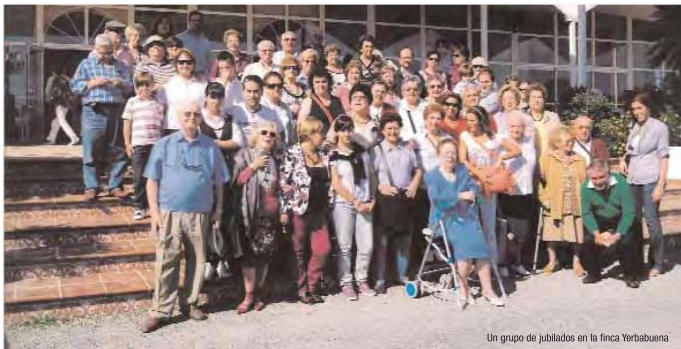
Un grupo de jubilados en la finca Yerbabuena