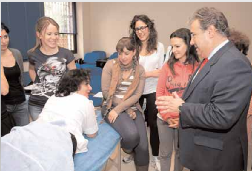
Zoido: dialoga con enfermeras asistentes a un taller de quiromasaje

Zoido, en tono cercano y distendido, no dudó en proclamar su capítulo de intenciones: "He querido visitar este Colegio para recoger las principales inquietudes sanitarias de la enfermería sevillana. Desde el conocimiento es, únicamente, donde se pueden aportar ideas y salidas. Me propongo hacer