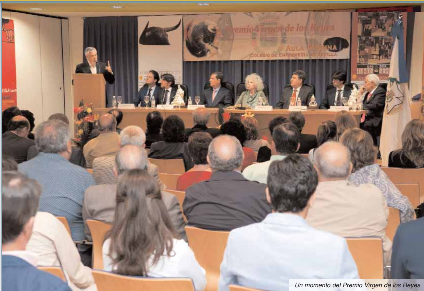
Un momento del Premio Virgen de los Reyes