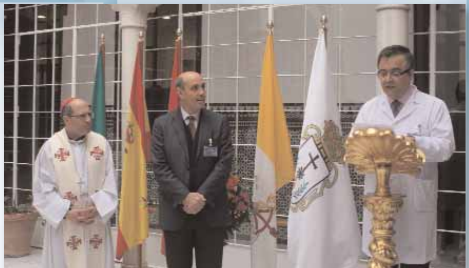
Acto inaugural del comedor social

Que la crisis afecta y se extiende, cada vez más, por amplias capas de la población es algo que no pueden ocultar ni las proclamas ni