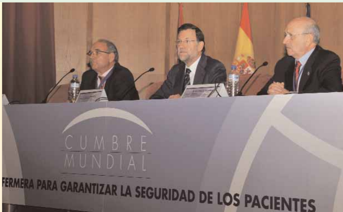
Mariano Rajoy entre los presidentes de médicos y enfermería españoles

Para mejor entenderlo, hay un ejemplo de plena actualidad que lo confirma. En Cataluña, es noticia de primer rango la severa crisis sanitaria que ha estallado en su Sistema público. El consejero, Boi Ruiz, ha anunciado fuertes medidas de contención del gasto (llámense cierre de plantas, camas, recortes en las contrataciones...) que, como anuncian expertos economistas, van a ser "necesariamente mimetizadas" por todas las regiones unas vez concluyan las próximas elecciones". De ahí que, frente al posicionamiento del Ministerio de Economía que dirige Elena Salgado, la voz de los presidentes de los organismos reguladores de las profesiones sanitarias en las principales naciones del mundo sirvió para dejar sentado que el profesional tiene la obligación de pertenecer a su órgano regulador y someterse a su disciplina deontológica, "con independencia de si trabaja para el sistema público o para la sanidad