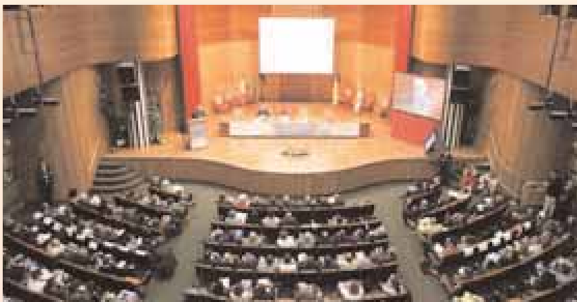
La cumbre en el Aula Ramón y Cajal

Aldabonazo, sin discusión, el que los Consejos Generales de Medicina y Enfermería de España protagonizaron en la Cumbre Mundial celebrada el 15 de abril en el Aula Magna la Facultad de Medicina de la Universidad Complutense, bajo el lema "Para garantizar la seguridad de los pacientes". Si no fuera bastante la presencia, masiva, de personal de ambos colectivos, a la misma se sumaron el Consejo Europeo de Profesiones Liberales, quien comprometió su apoyo frente a intentos desestabilizadores, así como responsables de las profesiones médicas y enfermera en el mundo avanzado: Alemania, Reino Unido, Francia, Brasil, Estados Unidos, Portugal, Italia y Australia. El respaldo, en fin, vino representado por el poder político con numerosos diputados y senadores encabezados por el presidente del PP Mariano Rajoy y la ministra de Sanidad Leire Pajín.