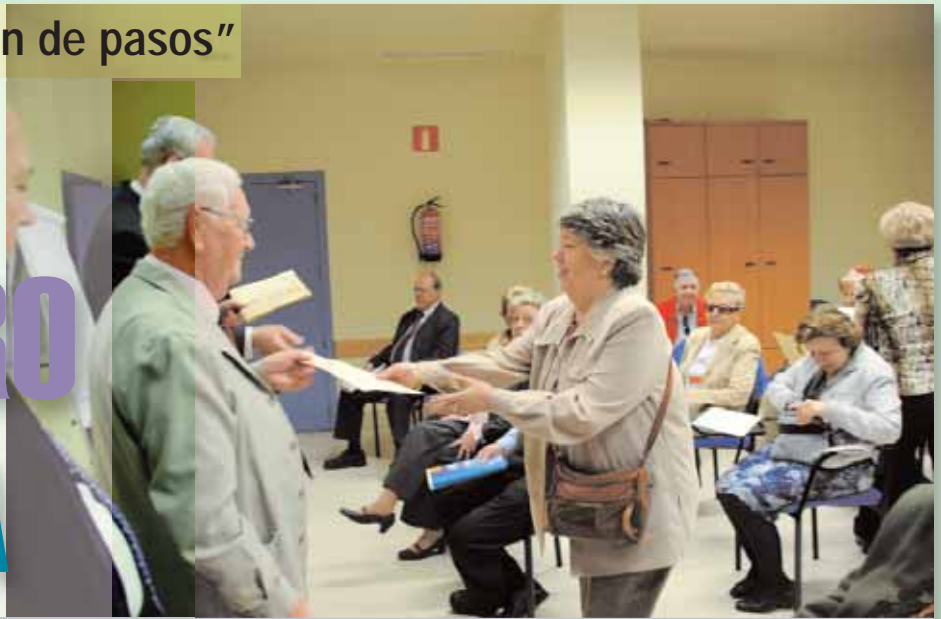
Certificación del ejercicio realizado