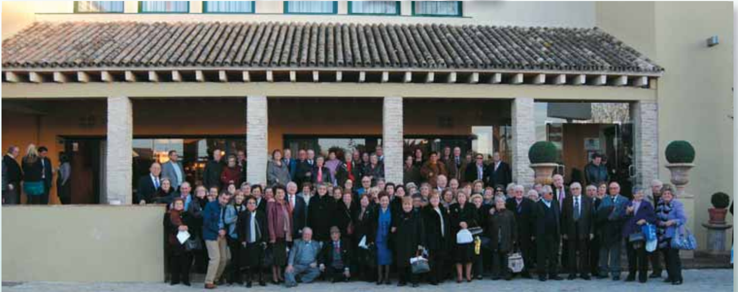
Sevilla.- Redacción.