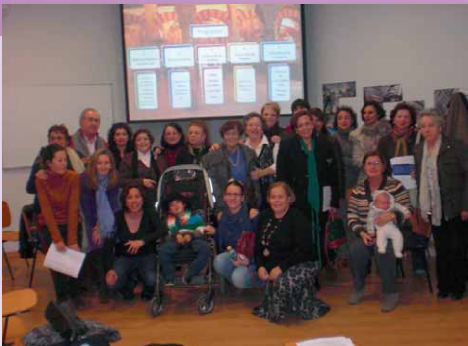
Un reciente encuentro de la Fundación

Aunque la Fundación surgió para acercarse al paciente paliativo hematológico, no descartan ofrecer su atención a otros enfermos víctimas de otros procesos: "Los enfermos -subrayan- son los que más nos enseñan. No somos expertos a la hora de plantear el tránsito al óbito. Si Enfermería esta capacitada en actitudes y habilidades, puede afrontar lo mejor de sí misma en el trance de la muerte. Y, no se olvide, es el propio paciente quién más nos enseña, acaso sin él saberlo. Quizá porque en el trabajo diario de los hospitales no se dice totalmente la verdad a los pacientes ocultándoles,