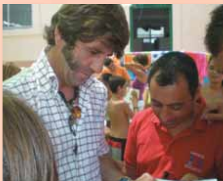
Padilla, cuando visitó el Campamento San Juan de Dios