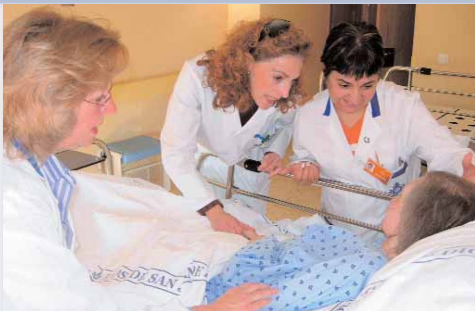
La Orden S.J. de Dios, precursora de los Comités de Ética Asistencial

La conferencia magistral estuvo a cargo del director del Instituto de