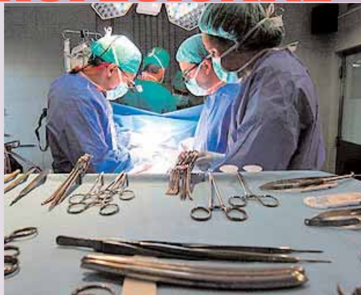
Profesionales sanitarios en un acto quirúrgico

La Carrera profesional, como se sabe, representa un complemento económico que afecta a diez categorías que se traduce en un plus de entre 400 y 12.000 euros anuales y que, hasta ahora, exigía de evaluaciones periódicas para ascender de nivel e incluso, para conservarlo. En virtud de este importante Fallo, se confirma que el nivel consolidado es para siempre porque no existe fundamento legal que prevea el descenso. ahora anulado como también queda derogada la necesidad de reevaluarse cada 5 años para conservar el nivel previamente logrado.