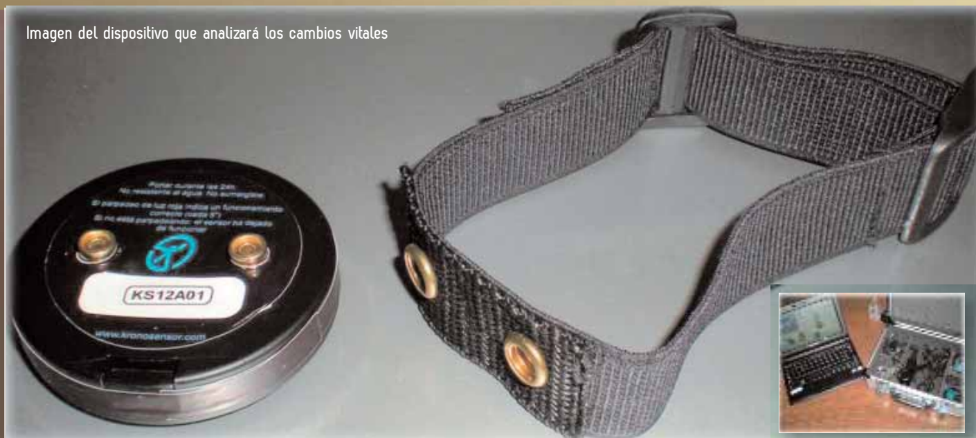
Imagen del dispositivo que analizará los cambios vitales

1.300 enfermeras de distintos hospitales españoles llevarán un "brazalete inteligente" que medirá el ritmo circadiano registrando todos los parámetros personales