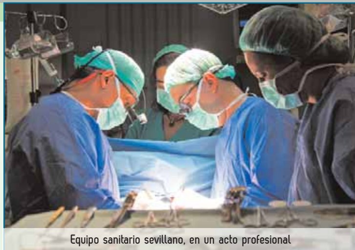
Equipo sanitario sevillano, en un acto profesional

cifrado en 2.500 millones de euros de los que solo 10 millones son en concepto de ayudas a determinados sindicatos. La consejera de Hacienda Carmen Martínez Aguayo, en la presentación de este Plan, se refirió a los menores recursos que recibirá Andalucía por parte de los presupuestos generales del Estado. Por esta razón, agregó, el objetivo de la Junta pasa por adoptar aquellas medidas que, de carácter temporal, permitan el ingreso de esos 1.000 millones de euros más de los anunciados y reducir el gasto en otros 2,500 millones de euros.