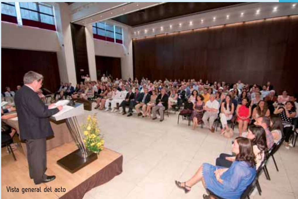
Vista general del acto