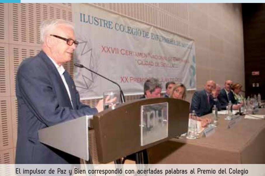
El impulsor de Paz y Bien correspondió con acertadas palabras al Premio del Colegio

La Asociación Paz y Bien de Sevilla, se lee en las argumentaciones del Jurado, ejecuta unas actuaciones desde el momento de su fundación, en el año 1979 "con un conjunto de emprendedores, solidarios y altruistas personajes que tienen altas cotas de motivación, conciencia y vocación para ejercer actuaciones prácticas desde el rigor, la eficacia y la calidad de su gestión. El Jurado ha entendido que Paz y Bien ha logrado traspasar