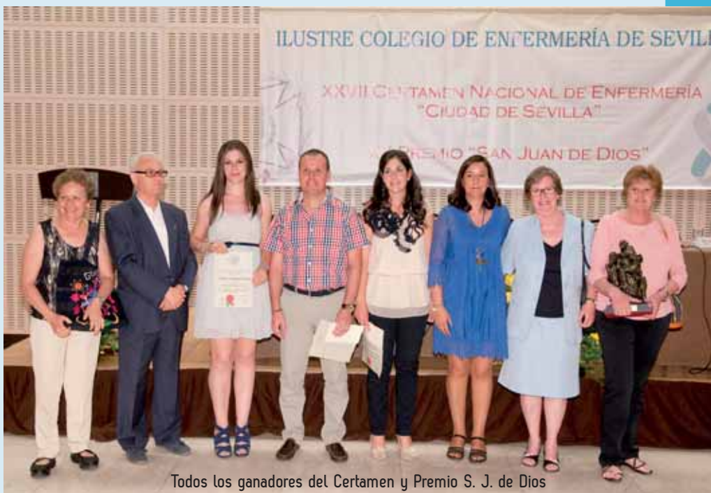
Todos los ganadores del Certamen y Premio S. J. de Dios