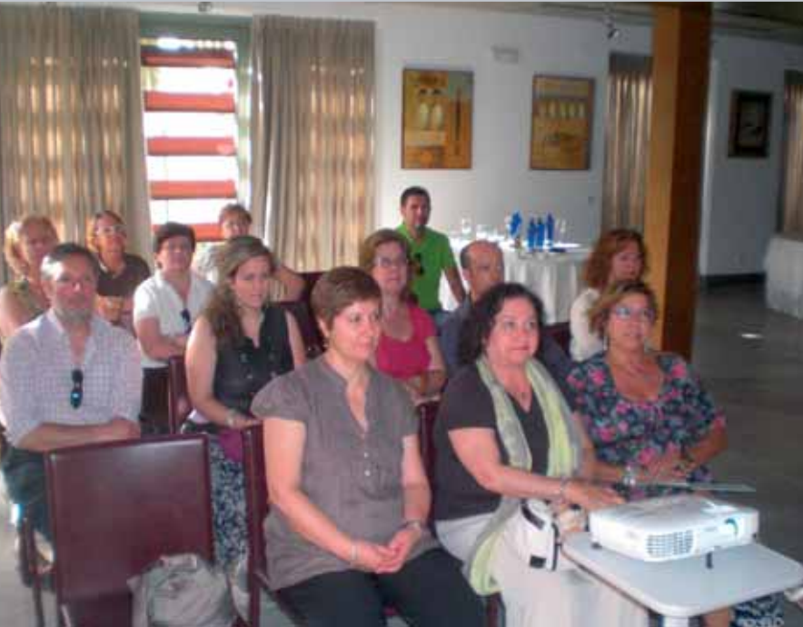
ASISTENTES AL CURSO SOBRE ANTICONCEPCIÓN