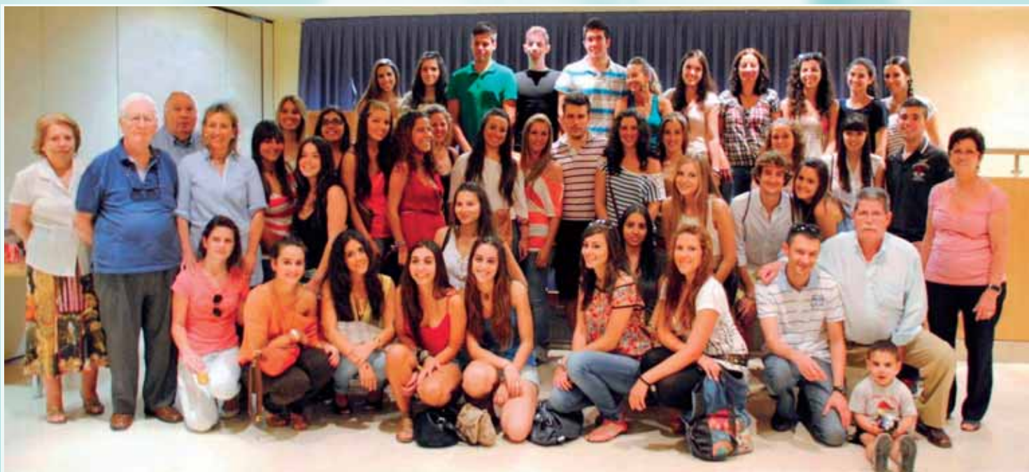
Sevilla.- 6º. N.

E l Colegio Oficial de Enfermería recibió a una amplia representación del alumnado de la Escuela Universitaria de Enfermería San Juan de Dios, sita en el Hospital Comarcal de Bormujos y, como se sabe, perteneciente a la Orden hospitalaria. La recepción corrió a cargo de la vicepresidenta,