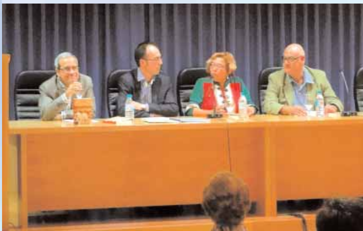
Imagen del acto de la presentación del libro