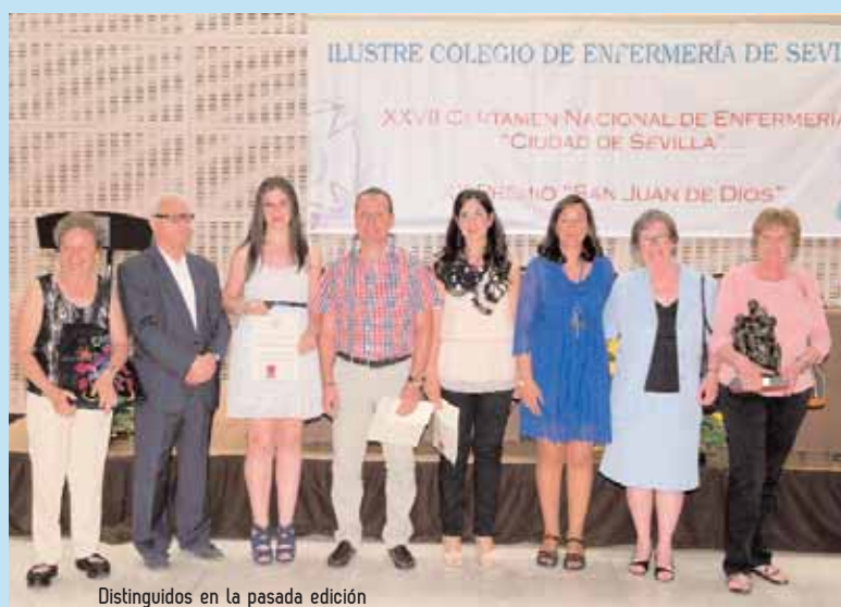
Distinguidos en la pasada edición