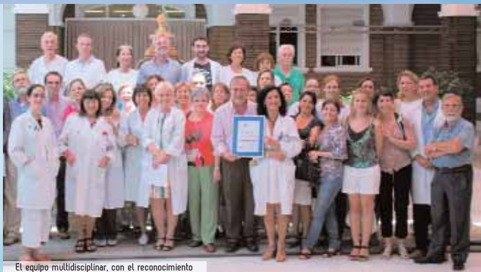
El equipo multidisciplinar, con el reconocimiento

La Unidad de gestión Clínica de Endocrinología y Nutrición del Hospital universitario Virgen del Rocío ha sido distinguida, por segundo año consecutivo, en el Área de Diabetes con el Premio "Best In Class" (BIC) que reconoce la excelencia además de la búsqueda de la mejora en la calidad de los servicios hospitalarios. Durante el año 2011 un equipo compuesto por medio centenar de profesionales atendió más de 32.000 consultas y 192 ingresos hospitalarios. La educación diabetológica, a cargo de enfermería, es una actividad relevante para este servicio que ha llegado a contabilizar, en el mismo periodo, más de 6.000 sesiones.