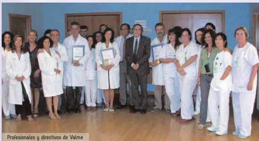
Profesionales y directivos de Valme

En lo referido al Bloque Quirúrgico del Valme, la Agencia ha destacado la apuesta por la seguridad del paciente, la calidad de los consenti-