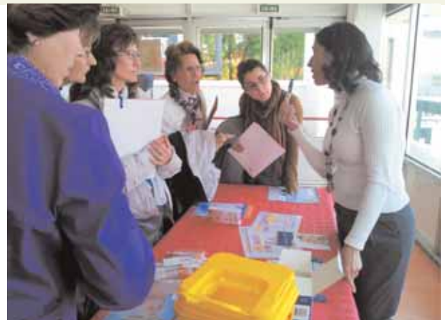
Profesionales de la Enfermería en uno de los talleres prácticos