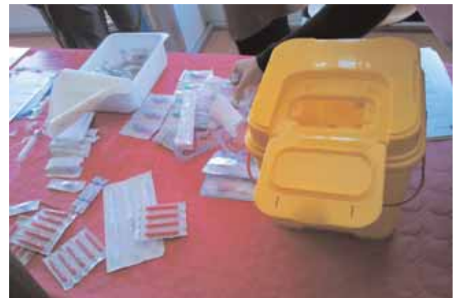
Material de bioseguridad usado durante los talleres prácticos