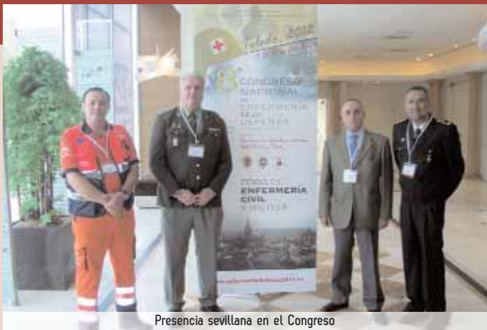
Presencia sevillana en el Congreso