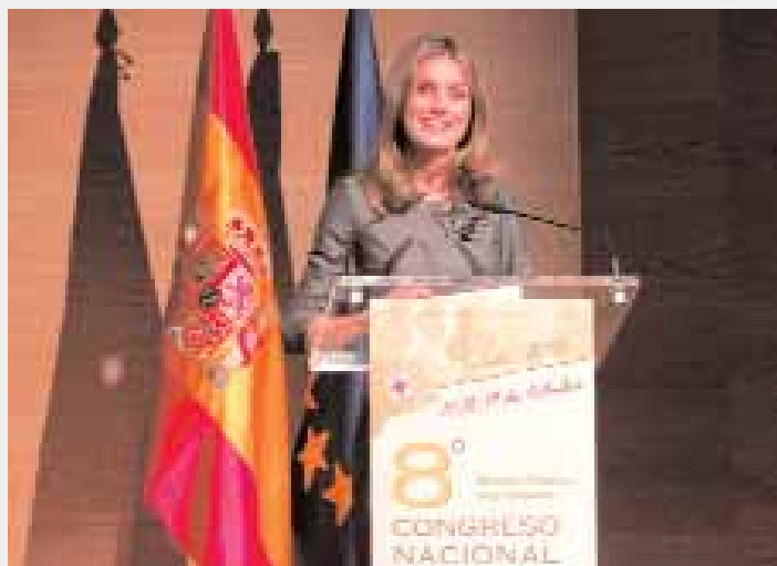
La Princesa de Asturias elogió a la enfermería

servido, también, para el enriquecimiento de la Enfermería vinculada a las Fuerzas Armadas así como un nuevo acercamiento entre la Enfermería de la Defensa y la civil de lo que se puede garantizar, según los representantes sevillanos allí destacados, "que se han acortado las distancias con el único objetivo de favorecer a quienes necesitan de nuestra ayuda, sean víctimas o pacientes".