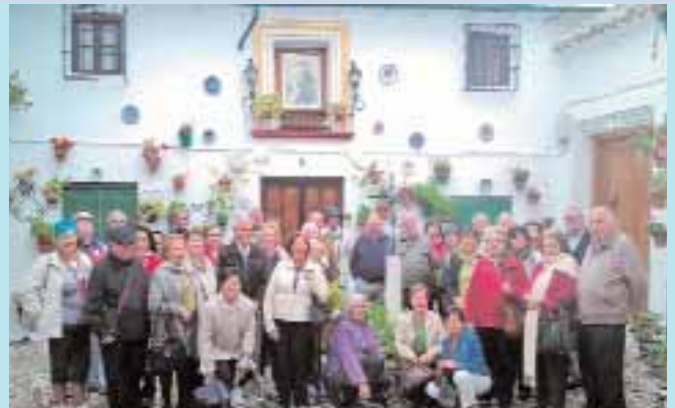
La Delegación de Jubilados en un patio de flores de ‘La Judería’ en Priego de Córdoba

La primera parada fue en Lucena, una ciudad de más de 35.000 habitantes y que se posiciona como la segunda en importancia de la provincia tras la capital. Alberga grandes reliquias artísticas y no es para menos, ya que su mejor legado es el estilo barroco. Los cuarenta viajeros pasaron por la Parroquia de San Mateo, la Plaza del Coso y Nueva, el Ayuntamiento y el Castillo del Moral. Sin embargo, la cultura y la identidad propia de la comarca de la Subbética continuó haciendo gala en Rute, donde la Delegación de Jubilados tuvo la oportunidad de visitar y degustar productos tradicionales en el Museo del Mantecado y el Museo del Anís. El viaje continuó hacia Priego de Córdoba, conocida también como la ‘Ciudad del Agua’ por la multitud de manantiales que brotan en su entorno, donde se sorprendieron por la historia de la Fuente del Rey, el Museo Histórico, el Barrio de la Villa, la Casa Museo y las iglesias de San Francisco y La Aurora. La siguiente parada la hicieron en el municipio de Zuheros que destaca por la singularidad de sus casas blancas