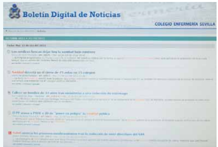
Visualización en la pantalla del ordenador del “Boletín Digital de Noticias”

Por otra parte, la investigación ‘EuroPNStyles’ resalta que la información especializada en Salud resulta difícil de comprender para el 45% de los encuestados españoles. En el resto de Europa la problemática es similar y la media de las