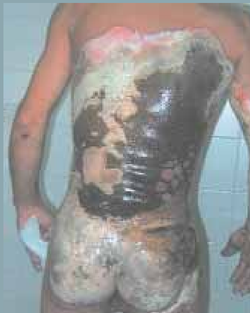
Imagen de la Guía

La "Guía de práctica clínica para el cuidado de personas que sufren quemaduras" es el título de una obra netamente enfermera y que merece ser difundida por su alto valor didáctico