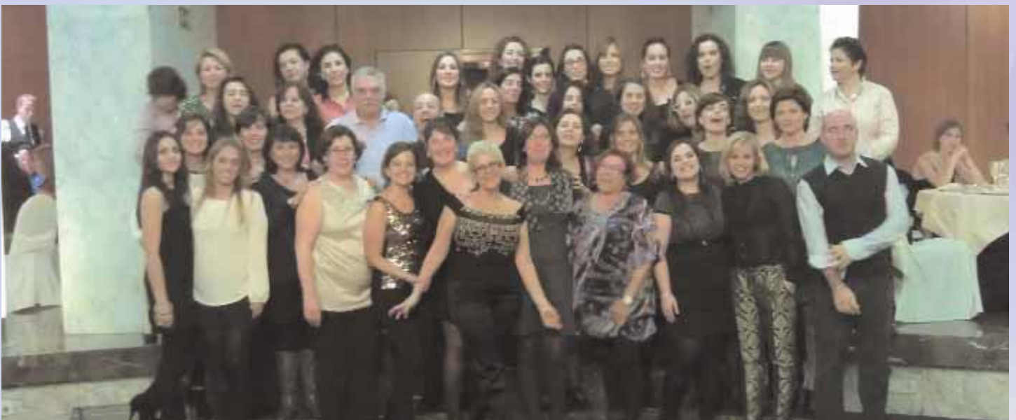
Las Matronas de Sevilla presentes en el Congreso de Murcia