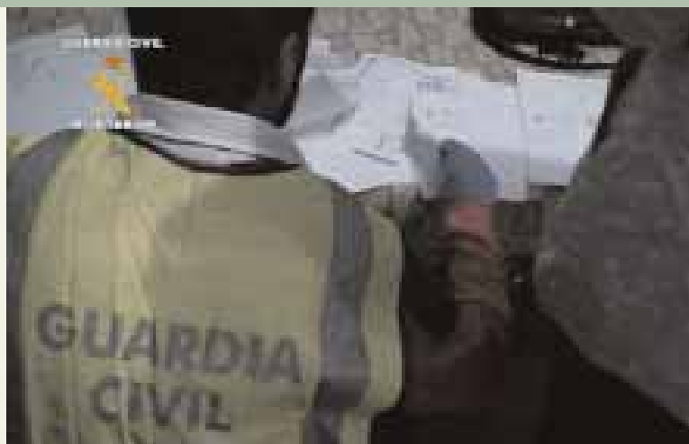
La Guardia Civil desmantela una red de falsificación de denuncias de violencia machista

La Guardia Civil dio cuenta de que la investigación se inició el pasado verano de 2011 cuando detectó un "aumento significativo de denuncias por violencia de género" entre ciudadanos marroquíes y que eran presentadas ante el puesto principal de la Guardia Civil en El Ejido (Almería) en las que coincidían una serie de "características y patrones comunes". Tras realizarse unas primeras investigaciones, los agentes localizaron a un grupo organizado integrado por tres personas, todas de nacionalidad marroquí, que se dedicaban a "buscar mujeres marroquíes en situación irregular en España", según el comunicado oficial del Benemérito Cuerpo, les ofrecían poder acceder a regularizar su situación administrativa "simulando ser víctimas de violencia de género", además de posibilitarles acceder a las ayudas económicas que se conceden en España para las víctimas de estos delitos.