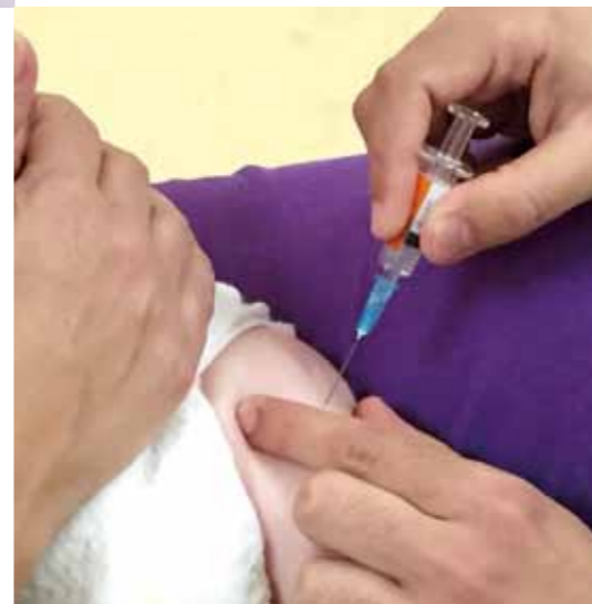
▲ Administración de una vacuna a un bebé.

R: Como con la administración de cualquier fármaco, un enfermero debe siempre considerar la aparición de una reacción alérgica, y estar preparado para tratar dicho evento. Una consulta de vacunas siempre está dotada de material para tratar dichas reacciones, y del personal cualificado. No obstante, son hechos muy poco frecuentes. ■