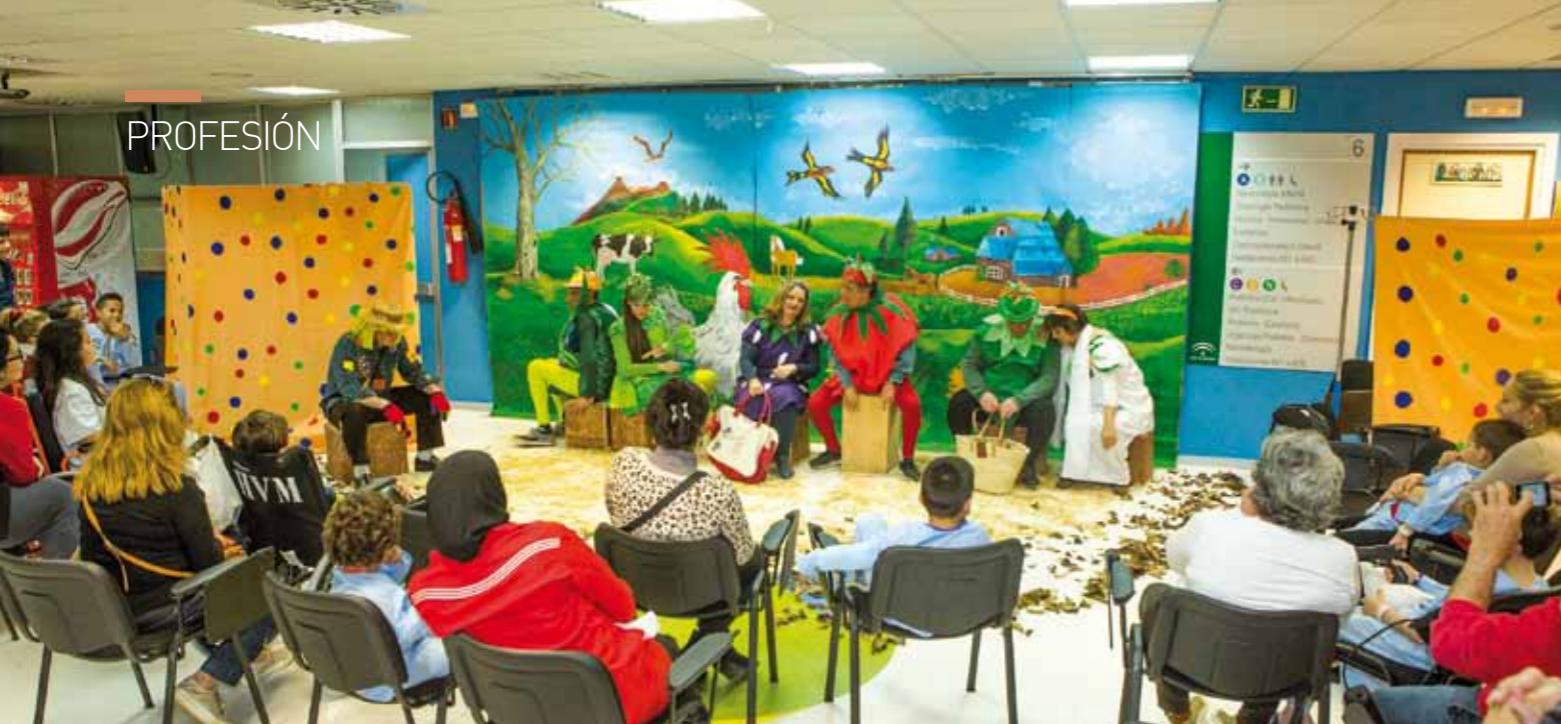
▲ Mediante el teatro los pacientes se divierten, expresan sus sentimientos y sienten más sus cuerpos y a ellos mismos.