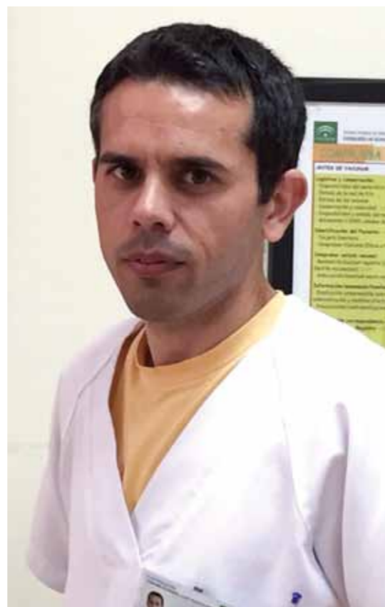
▲ Considera esencial la conciencia por parte de la población de la importancia de las vacunas.

R: La efectividad de la vacuna ha sido su mejor campaña. Muchas perso-