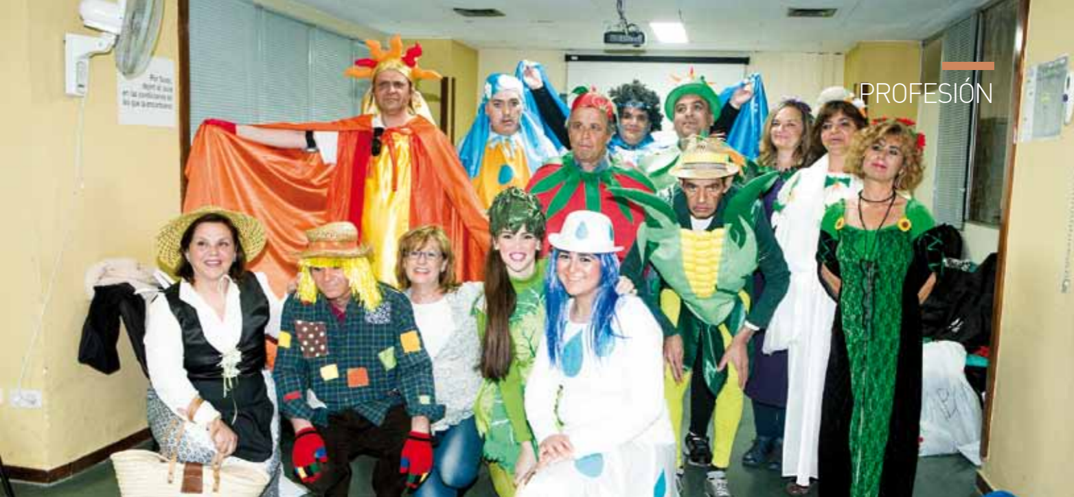
▲ Grupo de teatro de la Comunidad Terapéutica de Salud Mental del Área de Gestión Sanitaria Sur de Sevilla.