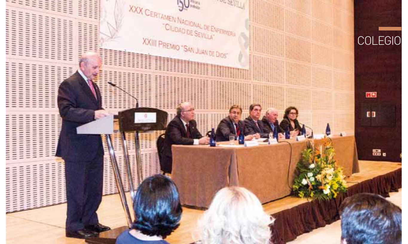
▲ El presidente de la Enfermería durante su discurso.