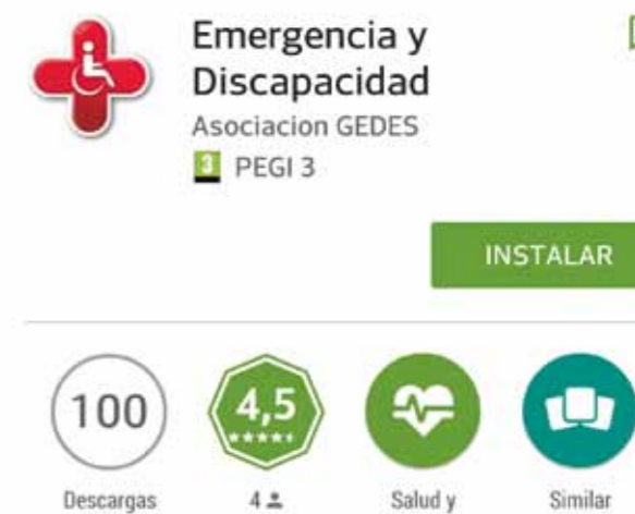
▲ Imagen de la app 'Emergencia y Discapacidad' en Play Store.