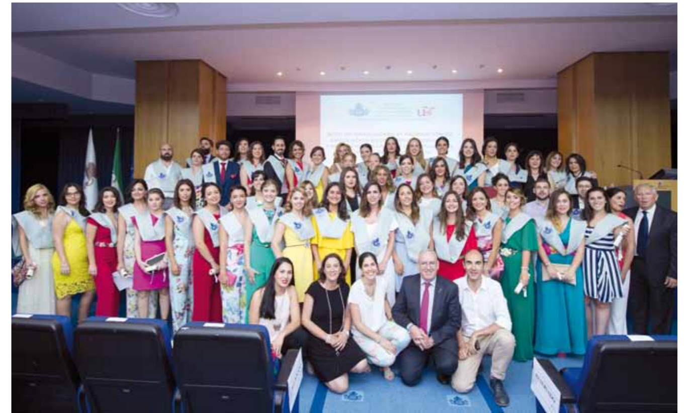
▲▲ Promoción de nuevos enfermeros/as del grado de Enfermería de San Juan de Dios. ■