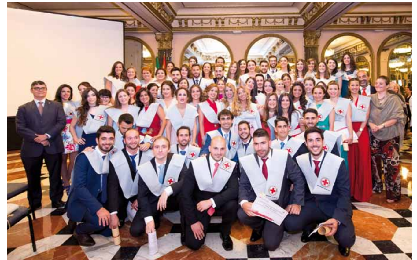
▼▼ Promoción de nuevos enfermeros/as del grado de Enfermería de Cruz Roja. ■