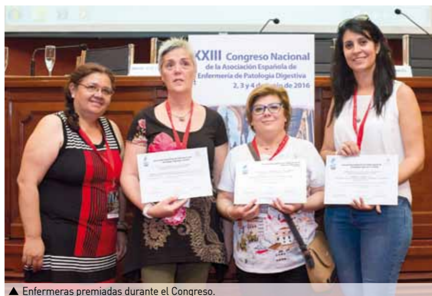
▲ Enfermeras premiadas durante el Congreso.

"La primera mesa redonda se formó para dar a conocer la magnífica unidad de sangrantes del servicio de Patología Digestiva del hospital Virgen del Rocío de Sevilla que, junto a la de Córdoba, son las únicas en Andalu-