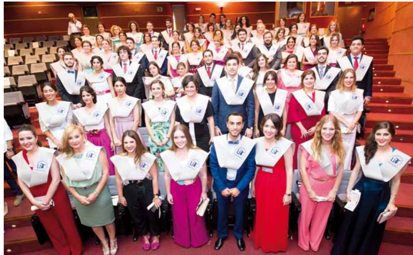
▲▲ Promoción de nuevos enfermeros/as del grado de Enfermería del Virgen del Rocío. ■