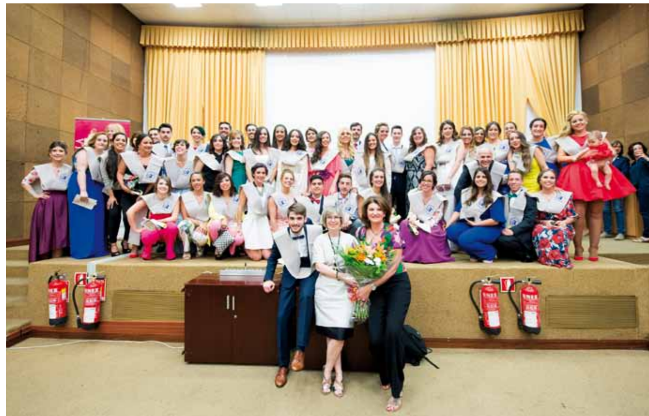
▼▼ Promoción de nuevos enfermeros/as del grado de Enfermería de Valme. ■