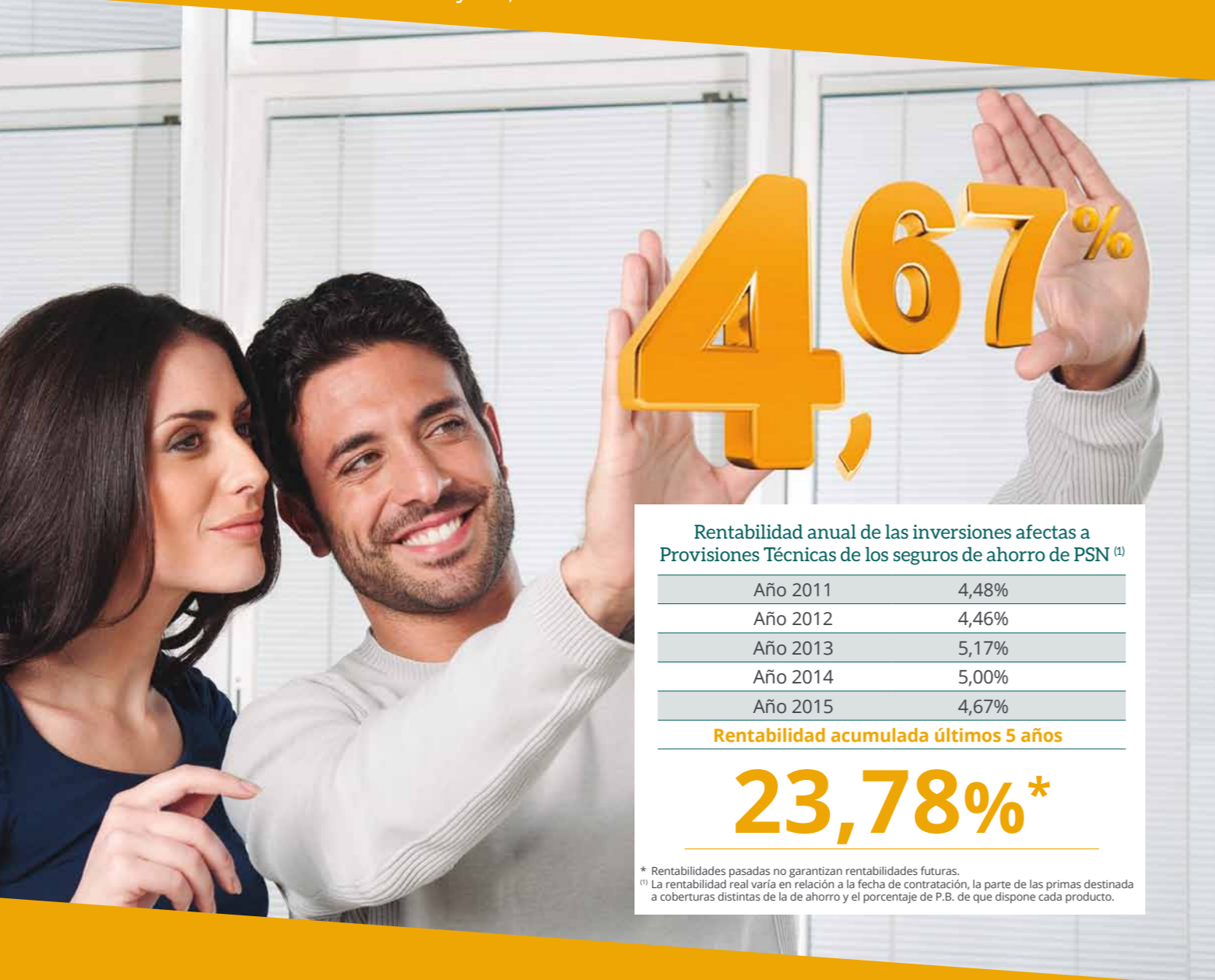
Rentabilidad anual de las inversiones afectas a Provisiones Técnicas de los seguros de ahorro de PSN (1)

Gracias a la póliza colectiva que mantiene nuestro Colegio con Previsión Sanitaria Nacional (PSN), la mutua de los profesionales universitarios, dispones de un seguro con cobertura por 3.000 euros en caso de fallecimiento accidental. Pero eso no es todo porque además mantenemos un convenio de colaboración que te abre las puertas de manera preferente a la amplia gama de productos y servicios del Grupo PSN, desde seguros para la protección personal y familiar, ahorro e inversiones hasta su fantástico complejo vacacional en San Juan, en Alicante.