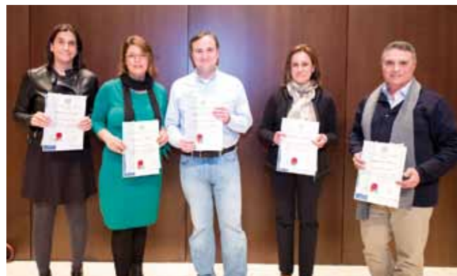
▲ Parte de los 250 enfermeros/as de trasplantes homenajeados por el Colegio de Enfermería de Sevilla durante el acto.

los órganos en el territorio nacional, ya que por segundo año consecutivo España ha superado los 100 trasplantes por millón de población. Esto se traduce en que los españoles son los ciudadanos que más posibilidades tienen en el mundo de acceder a un trasplante cuando lo necesiten, algo que también se debe a la solidaridad entre comunidades autónomas al realizar intercambios de órganos. Aunque mejor aún es que Andalucía se encuentra entre las regiones con mayor incremento en el aumento de donaciones. ■