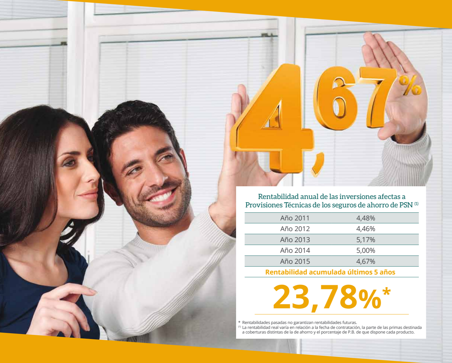
Rentabilidad anual de las inversiones afectas a Provisiones Técnicas de los seguros de ahorro de PSN (1)

Gracias a la póliza colectiva que mantiene nuestro Colegio con Previsión Sanitaria Nacional (PSN), la mutua de los profesionales universitarios, dispones de un seguro con cobertura por 3.000 euros en caso de fallecimiento accidental. Pero eso no es todo porque además mantenemos un convenio de colaboración que te abre las puertas de manera preferente a la amplia gama de productos y servicios del Grupo PSN, desde seguros para la protección personal y familiar, ahorro e inversiones hasta su fantástico complejo vacacional en San Juan, en Alicante.