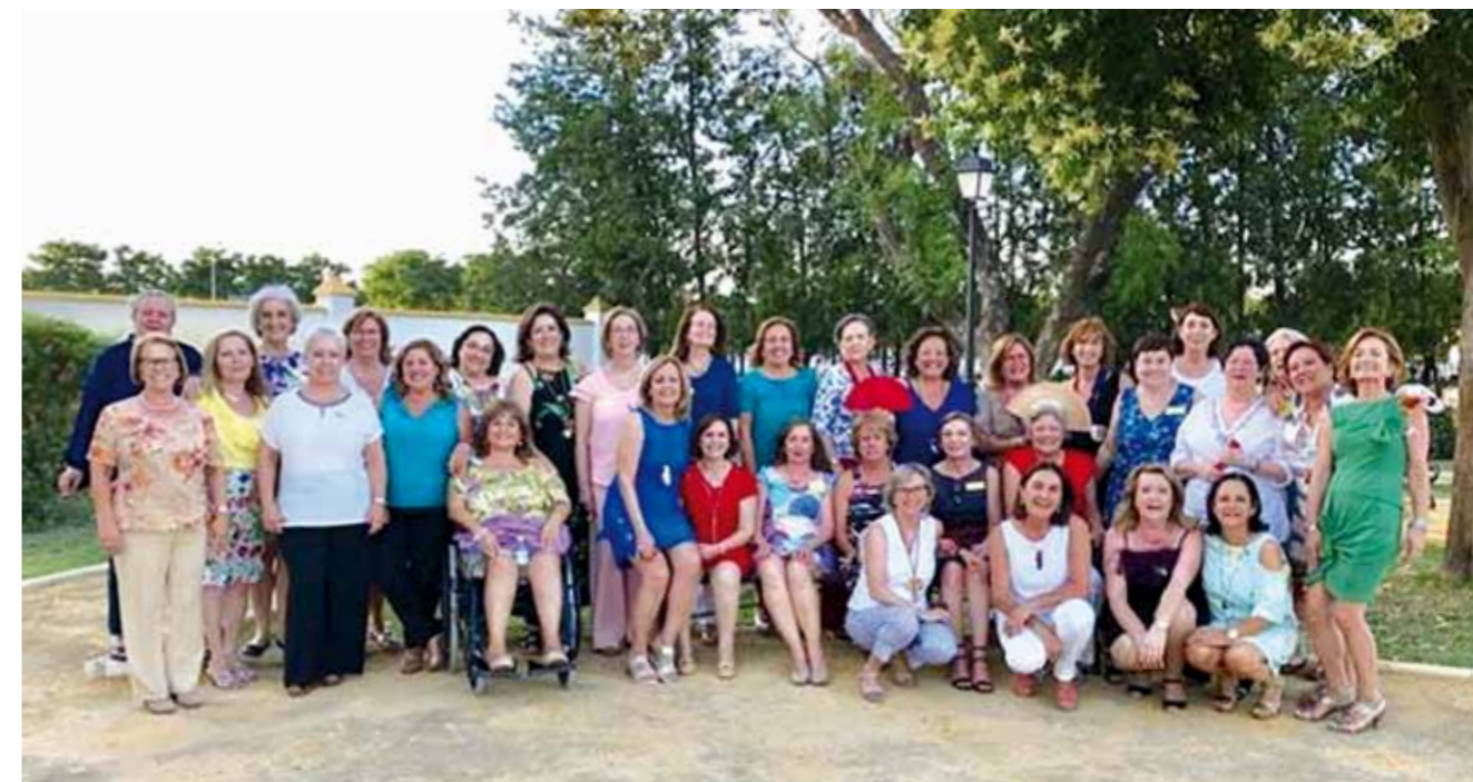
▲▲ EFATSME. Encuentro de las promociones de enfermeras que cursaron sus estudios en la Escuela EFATSME entre los años 1975 y 1980. ■