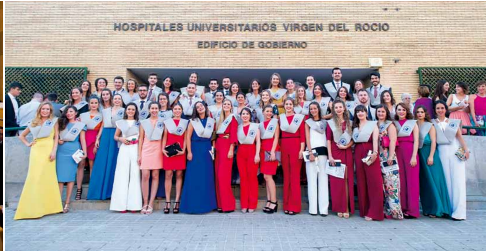
▲▲ Virgen del Rocío. Promoción de nuevos enfermeros del grado en Enfermería del Virgen del Rocío. ■