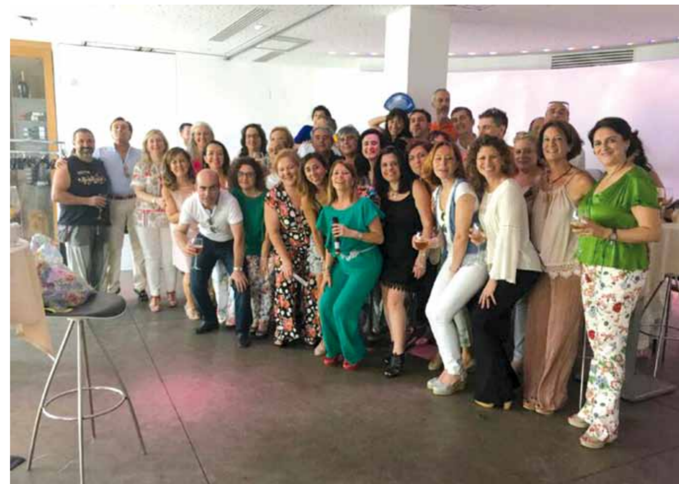
▼▼ Virgen Macarena. Encuentro por el 25 aniversario de la promoción de enfermeros 1989-1992 del Hospital Universitario Virgen Macarena. ■