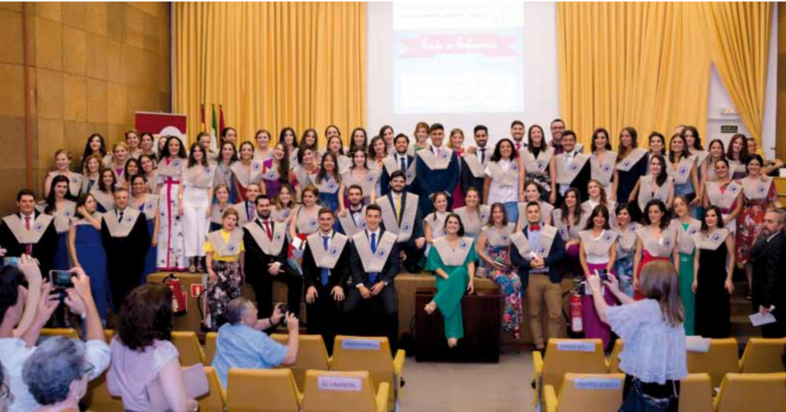
▲▲ Virgen Macarena. Promoción de nuevos enfermeros del grado en Enfermería del Macarena. ■