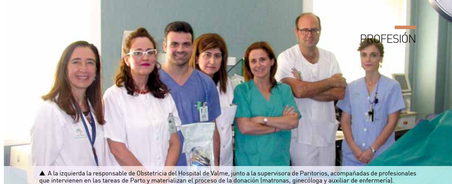
▲ A la izquierda la responsable de Obstetricia del Hospital de Valme, junto a la supervisora de Paritorios, acompañadas de profesionales que intervienen en las tareas de Parto y materializan el proceso de la donación (matronas, ginecóloga y auxiliar de enfermería).