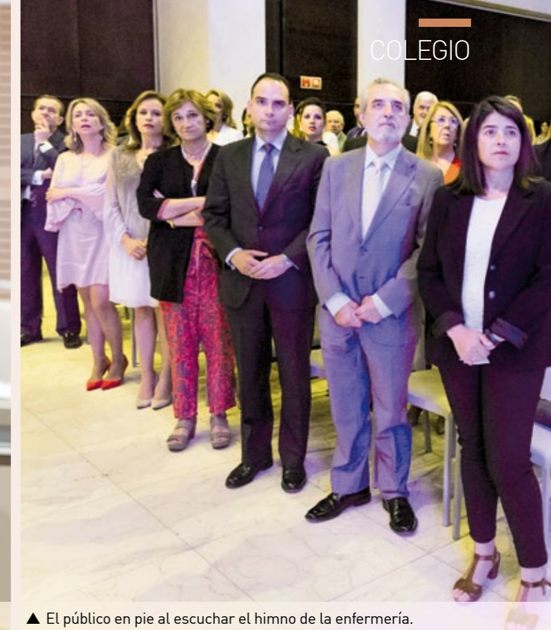
▲ El público en pie al escuchar el himno de la enfermería.