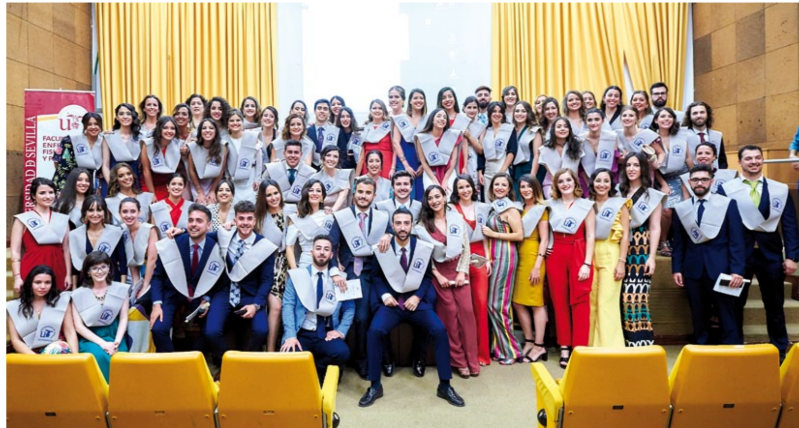
▼▼ Promoción de nuevos enfermeros del Grado en Enfermería del Macarena. ■