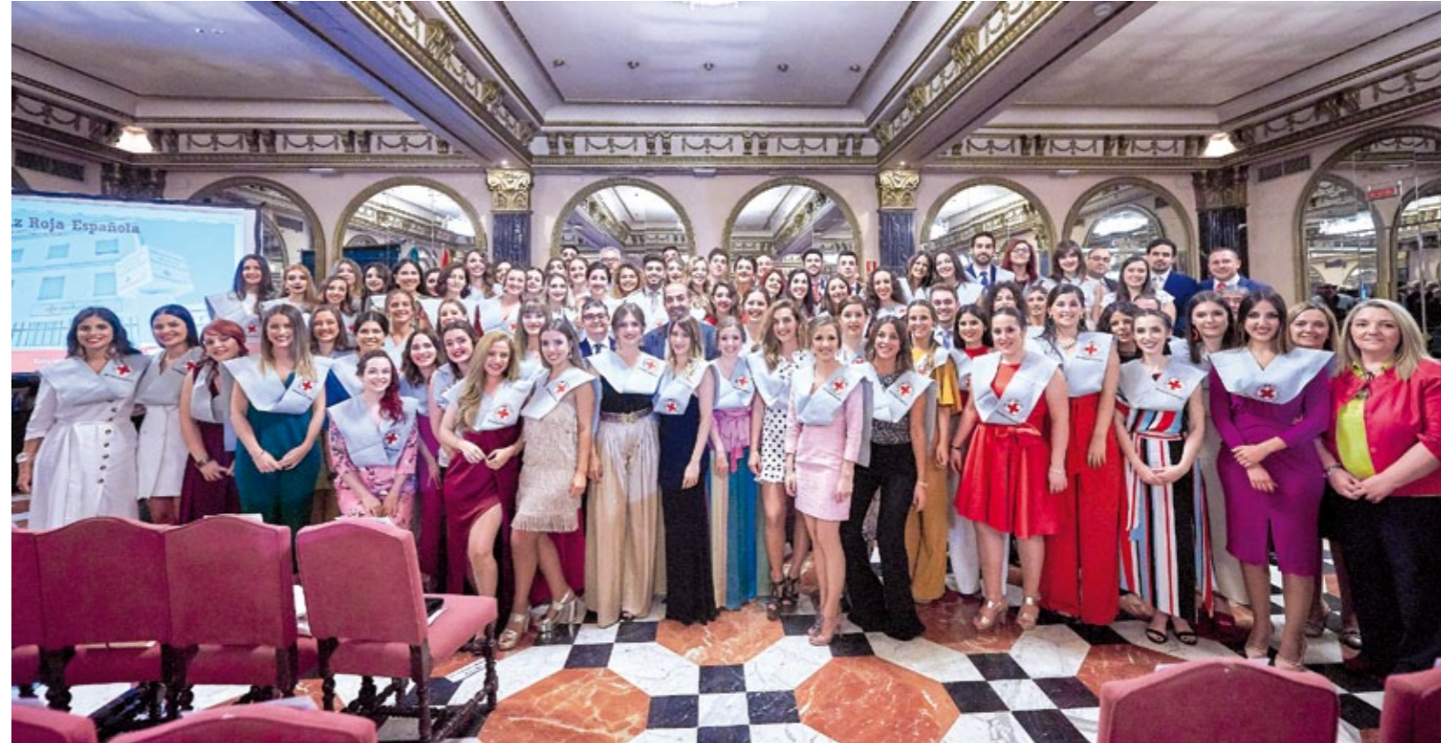
▲▲ Promoción de nuevos enfermeros del Grado en Enfermería de Cruz Roja. ■