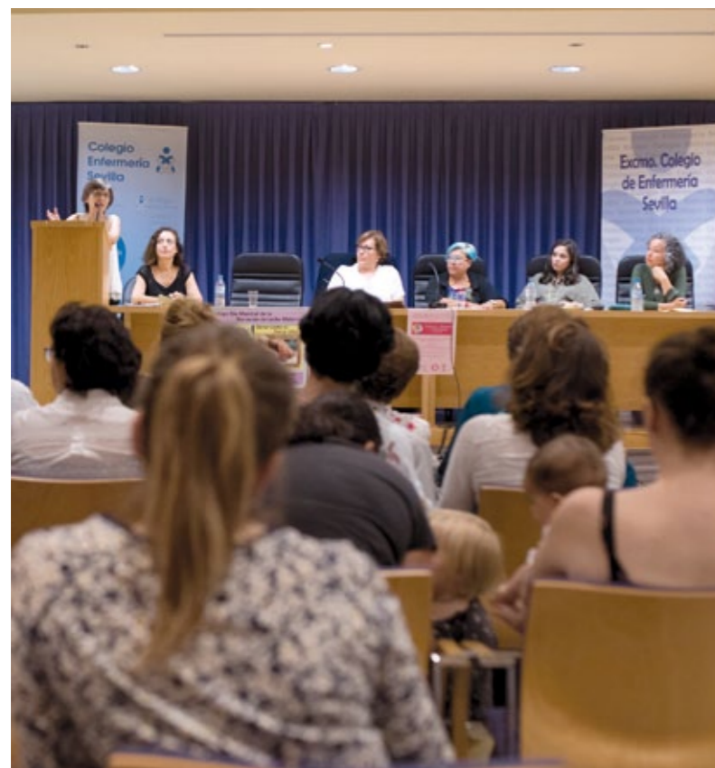
▲ El numeroso público compuesto por matronas, residentes, madres, padres y niños.