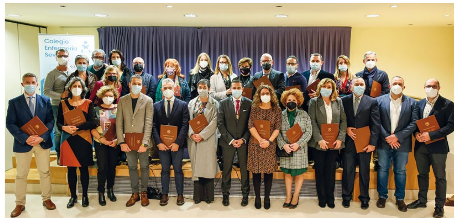
▲ Algunos de los miembros de la nueva Comisión Plenaria del Colegio de Enfermería de Sevilla.